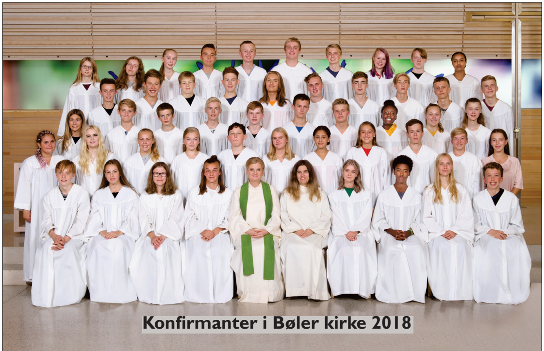
Konfirmanter i Bøler kirke 2018

Mine Damer og Herrer Lions Club Oslo Bøler ønsker flere medlemmer og støtte til sitt lokale humanitært arbeid