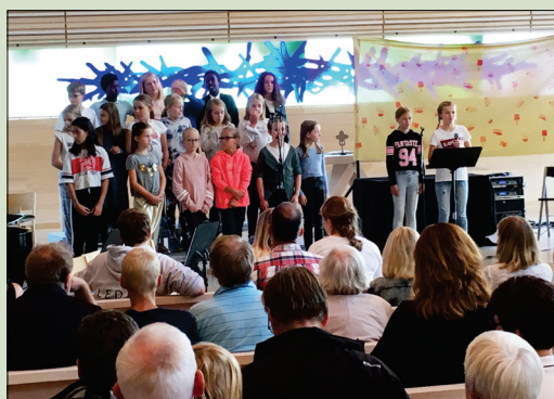
Fra musikalforestillingen i kirken som avsluttet feriecampen

Temaet for festivalen var: Vær deg selv, stå opp for andre.