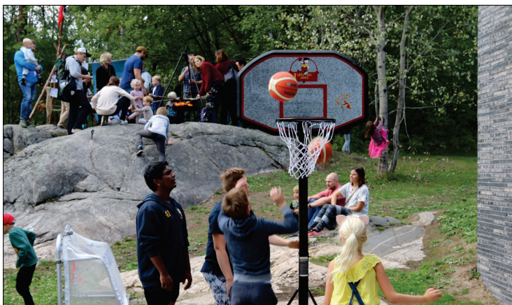
Noen prøvde seg på basketball, andre var hos speideren og lagde pinnebrød