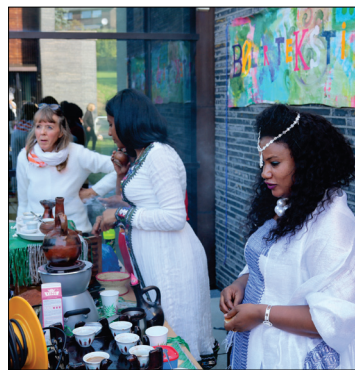
Bøler tekstilverksted hadde sin egen stand der det ble servert etiopisk kaffe med popcorn. Etioperne har sin egen kaffeseremoni der brenning av kaffebønnene hører med.