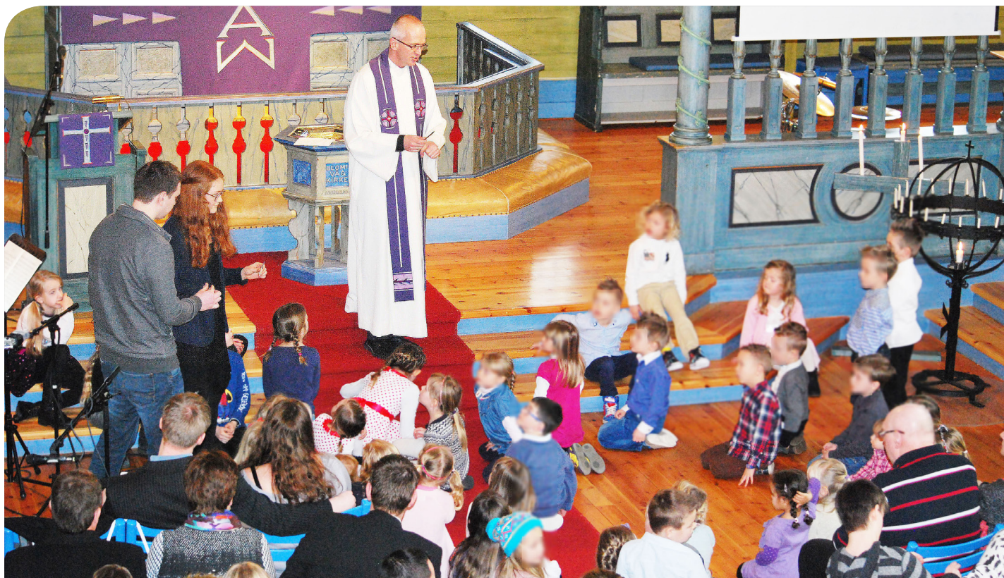
Frå ei familiegudsteneste i Blomvåg kyrkje med svært interesserte born.