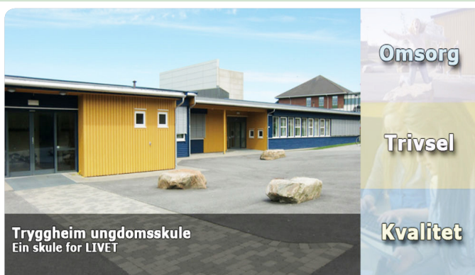
Trygheim ungdomsskule på Nærbø, eigd av NLM.