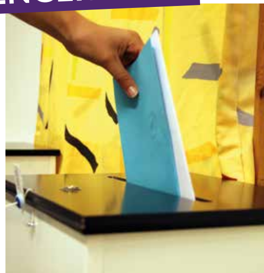
Din stemme er med på å bevare Den norske kirke som landets største demokratiske medlemsorganisasjon.