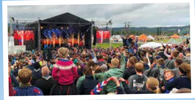
Stemningen er på topp på avslutningsshowet siste kvelden!!

Under science day: Speiderne har fått en eksperimentkoffert med utstyr som gjør at de kan prøve seg som forskere. Dette gjennomføres i patruljen. Patruljen er en gruppe med ca 5-8 speidere. Patruljesystemet bidrar til samhold, samarbeid og at speiderne tar ansvar for seg selv og de andre i patruljen.