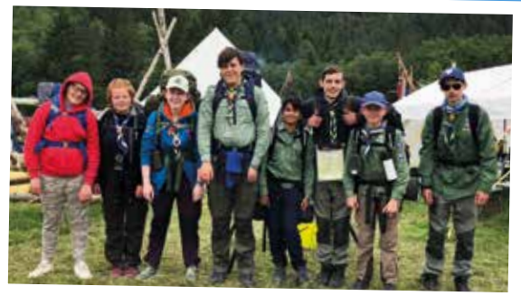
Her er patruljen fra Stovner og Furuset klare for å gå på haik.

Leirbygging: På speiderleir bygger vi bord og inngangsparti til gruppeområdet ved hjelp av trestokker og tau. Alle hjelper til og får bruk for knuter og annet de har lært på speidermøtene.