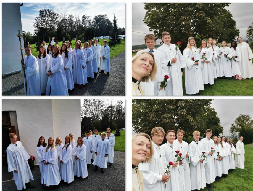
Selfie hører sel(f)følgelig med på en merkedag.

Kick-off er en lørdagssamling og fasteaksjonen var i samarbeid med Torsnes og Gamle Fredrikstad menigheter og felles for alle av Østsidens konfirmanter. Vi må selvfølgelig nevne leir på Solbukta den 26. - 28. april. Her deltok over hundre av Østsidens konfirmanter, og med sol og fine konfirmanter så ble det rom for å skape gode minner.