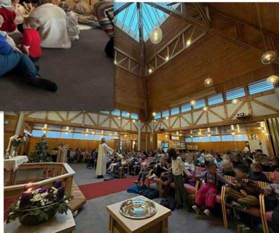
Temagudstjenester; Skolegudstjeneste hvor jul var sentralt.

Det ble gjennomført skolegudstjenester med godt oppmøte fra alle klassetrinn for enkeltvis Borge barneskole i Borge kirke, Kjølberg og Torp barneskole på Kjølstad, samt på Årum skole. Begby skole har ikke hatt julegudstjeneste, men vi har nå et samarbeid gjennom hele året for 4., 7. og 10. trinn med besøk i kirke, kapellet eller av prest på skole. Det jobbes med å få startet opp lignende samarbeid i første omgang med Torp, men også steg for steg med de andre skolene i sognet.