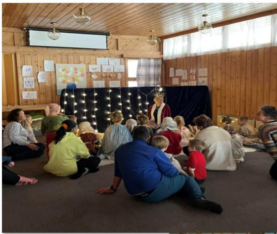
Tilbud tilpasset de ulike livsfasene; Barnehagebarn på julevandring

Grunnet delvis sykemelding ble det bare satt av to dager til julevandring hvor 5 barnehager fikk oppleve julevandring. Totalt var det i overkant av 60 barn inntatt fordelt på 5 vandringer, og Kjølstad kirke var så heldig og fikk nydelige engler i gave av barnehagene. Disse er blitt tatt vare på, og vil neste år få være en del av kirkerommet i adventstiden i 2025.