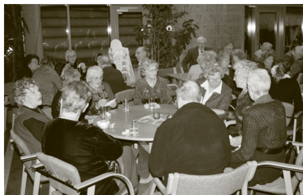
Mens deltakerne, rundt 75 i tallet koste seg med mat gikk praten livlig.