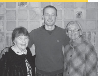
Mot vår i en ny kirke og Nykirke side 8