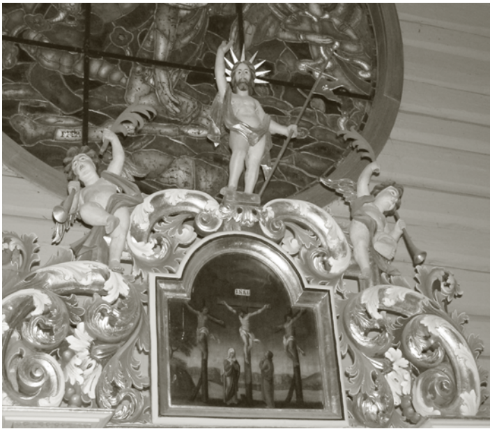
Altartavlen i Nykirke.