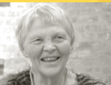
Frivillighetsprisen side 6