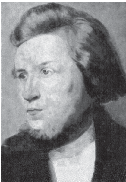
Hans Nilsen Hauge.

Har Hans Nilsen Hauge besøkt Modum? Noen spør om det. Vi vet at Hauge hadde kjente i Modum. På sine reiser fra Eiker og rundt i landet har Hauge vært innom Modum. Han var også her på besøk etter sitt lange fengselsopphold.