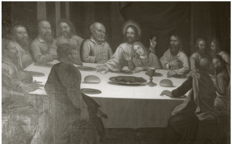
Bildet fra Nykirke viser Jesu siste måltid, nattverden.

Matt. 13, 21-28: Da Jesus hadde sagt dette, ble han rystet i sitt innerste og sa rett ut: «Sannelig, sannelig, jeg sier dere: En av dere skal forråde meg.»