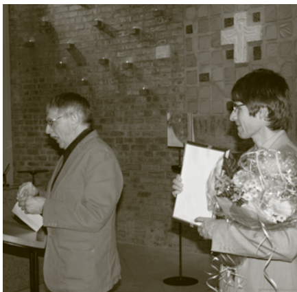
And the winner is...