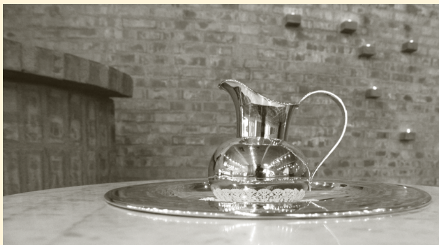
Døpefont i Åmot kirke.

Mange av menneskene jeg har møtt gjennom prestetjenesten i Modum har fortalt at de ble sunget for da de var små. "Kjære Gud, jeg har det godt!" er gjengangeren! Dette har de opplevd trygt og godt. Når de nå er blitt foreldre selv viderefører de denne fine tradisjonen med sine egne barn. Men hva gjør vi når barna opplever at de er blitt for store for denne barnesangen? Hva skjer med den barnlige tilliten til Gud når sykdommen herjer, når skilsmissemis er et faktum, når uro og bekymring preger dagene? Hvordan er det da å synge "Kjære Gud, jeg har det godt"? Da står vi overfor hummerens utfordrende vågestykke slik Jens Bjørneboe beskriver det i boka "Blåmann".