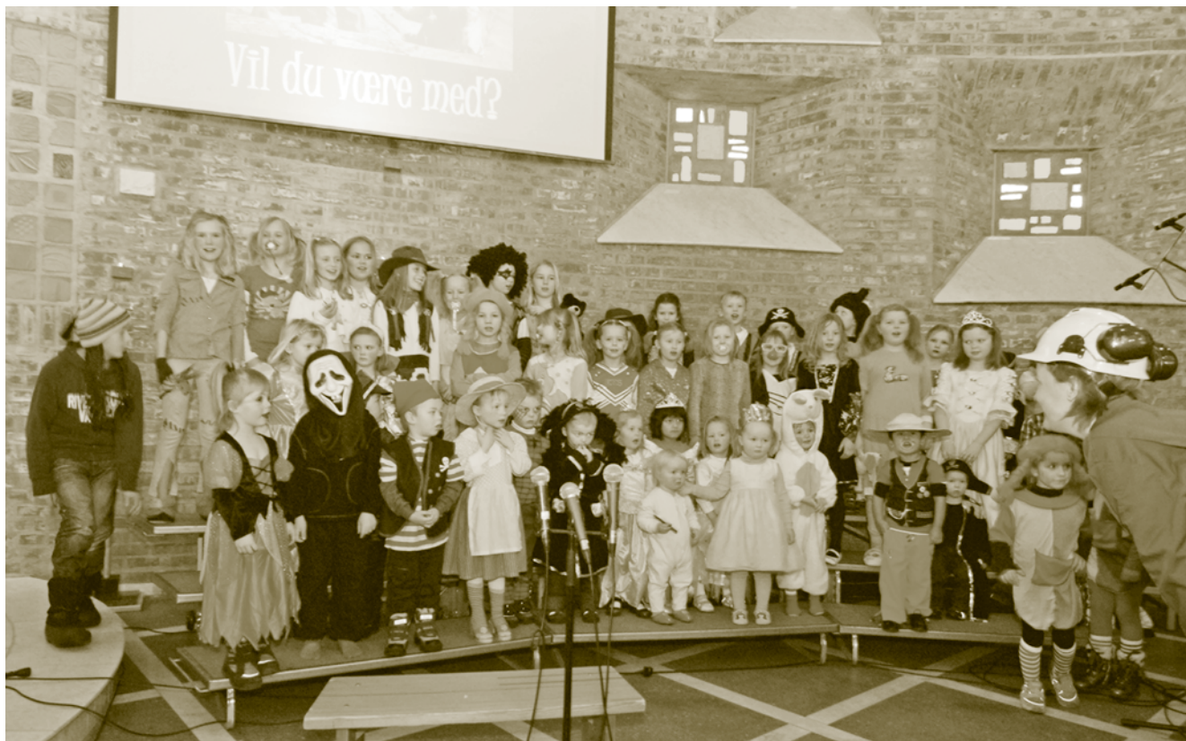
Åmot barnegospel synger under karnevalsgudstjenesten i Åmot kirke i innledningen til fasten.

Noen kaller det karneval av det latinske carneval som bokstavelig oversatt betyr "kjøttpause". I vår tradisjon kalles den samme perioden i kirkeåret for fastetiden, og vi bruker den lille fargen til å symbolisere ettertanke og bot. Fastetiden begynner på sett og vis søndag før faste, bedre kjent som fastelavns søndag. Dette er fra gammelt av en festkveld før en går inn i den uken som markerer starten på fastetiden. Hos oss kjenner vi jo de deilige fastelavnsbollene og fastelavnsris, som sanitetsforeningene i selger til inntekt for gode formål. Etter denne festdagen kommer så Blåmandag, etterfulgt av Fetetirs dag, som så var siste mulighet til "å fete seg opp" før Askeonsdag. Askeonsdag er innledning til fasteti-