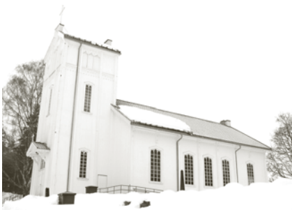
Nykirke i vårløysinga.