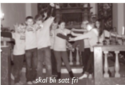
skal bli satt fri

Natt til 1. søndag i advent var det nyttårsnatt i Åmot og Heggen kirke. Alle våre 6. klassinger var invitert til å være med på arrangementet LysVåken – overnatte i din egen kirke!! "Det er jo første gangen vi gjør dette