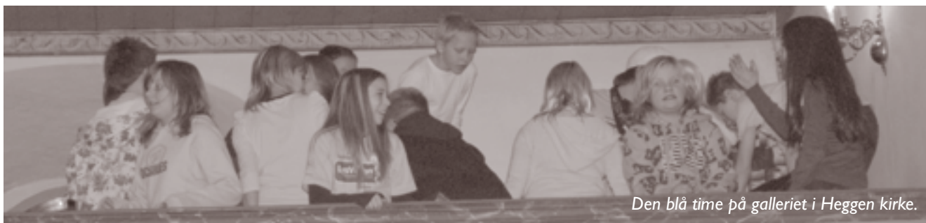
Den blå time på galleriet i Heggen kirke.