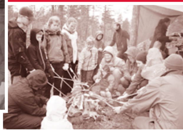
Pølsegrilling i regnet ved Sysletjern.