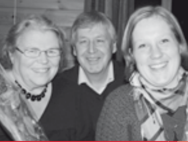
Menighetsrådet side 4