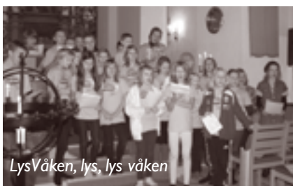
LysVåken, lys, lys våken