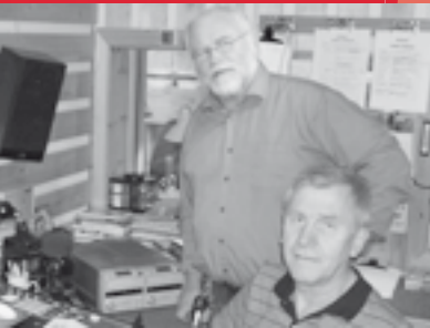
Radio Modum side 10