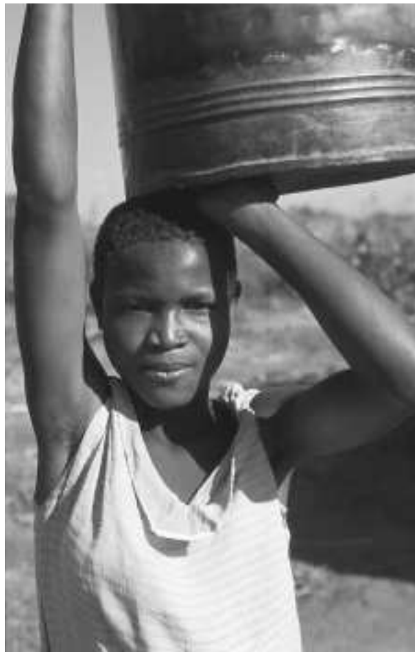
Patuma henter vann.

Søndag 21. mars, to dager før dør-til-dør-aksjonen, blir det et kulturarrangement i Åmot kirke. Kvelden vil inneholde en kunstauksjon med bidrag fra lokale kunstnere og håndverkere. I tillegg blir det en konsert og mulig besøk fra en ansatt i Kirkens Nødhjelp. Alle inntekter denne kvelden vil gå til fasteaksjonen.