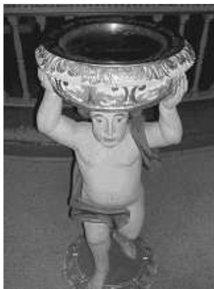
Døpefonten i Nykirke.

Har Jesus en slik holdning, må vi som fellesskap i kirken ha en slik holdning. Det skal være rom for barna! For gjennom dåpen har de fått en likeverdig plass i fellesskapet. De er like verdifulle og viktige som organisten eller dama som har sitter i menighetsrådet. Barna har også behov som vi skal forsøke å møte på