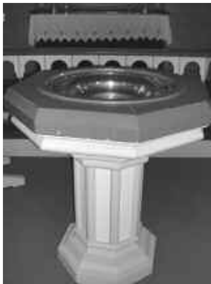
Døpefonten i Rud kirke.

når vi voksne krenker barna våre med hardhet, sinne, trusler eller urettferdige grenser, så fortjener de at vi ber dem om tilgivelse. Men skjønner de noe av dette? Selv om ikke små barn kan sette egne ord på hva som skjer, så har de fått med seg at overtrampet vårt skjedde. I tillegg merker de angeren i ansiktsut-