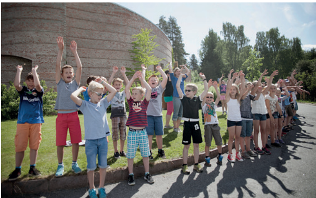
Vi tar bølgen.