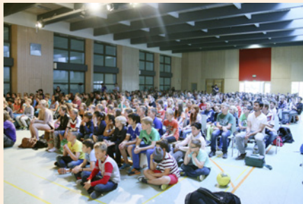
Mange tilskuere fant veien til konsertene.