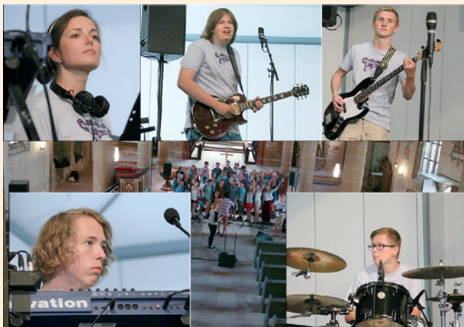
Heggen Gospel bandet.