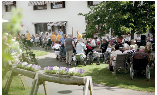
Slapper av i sansehagen.