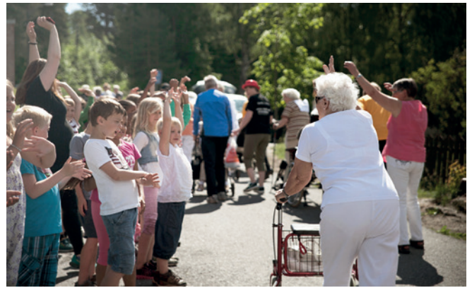
Deltagerne blir applaudert opp kirkebakken.