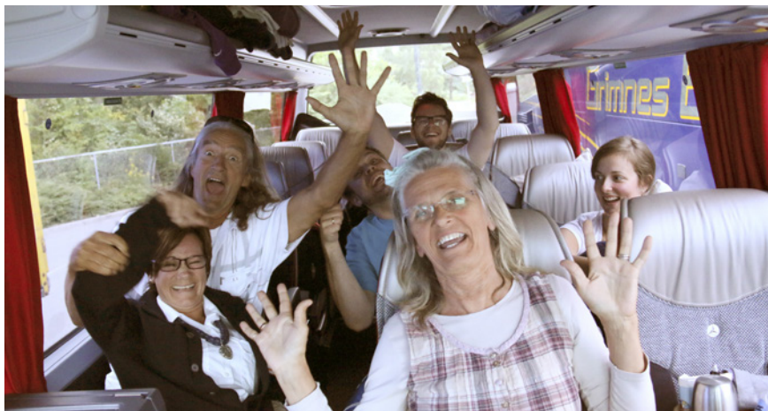
Glade voksenledere på turneen til Tyskland.