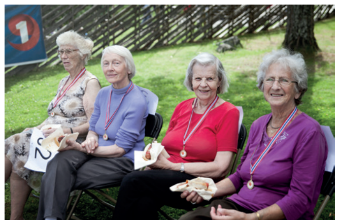
Flotte damer med deltakermedaljer rundt halsen.