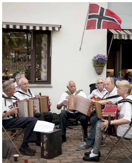
Modum toraderlag fikk det til å rykke i dansefoten hos noen og enhver.