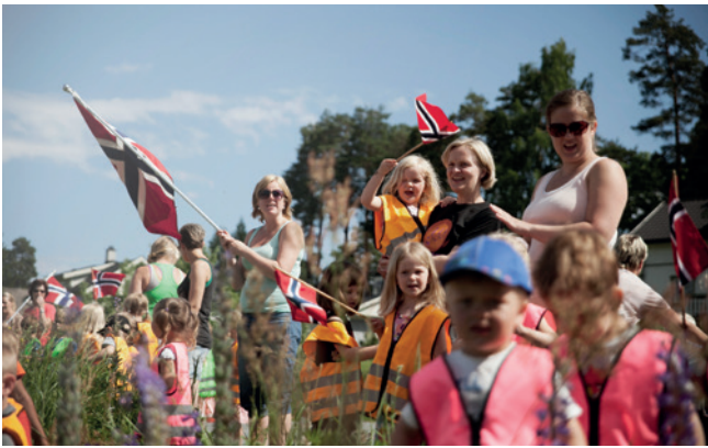
Bårudåsen barnehage er ivrig heiagjeng.