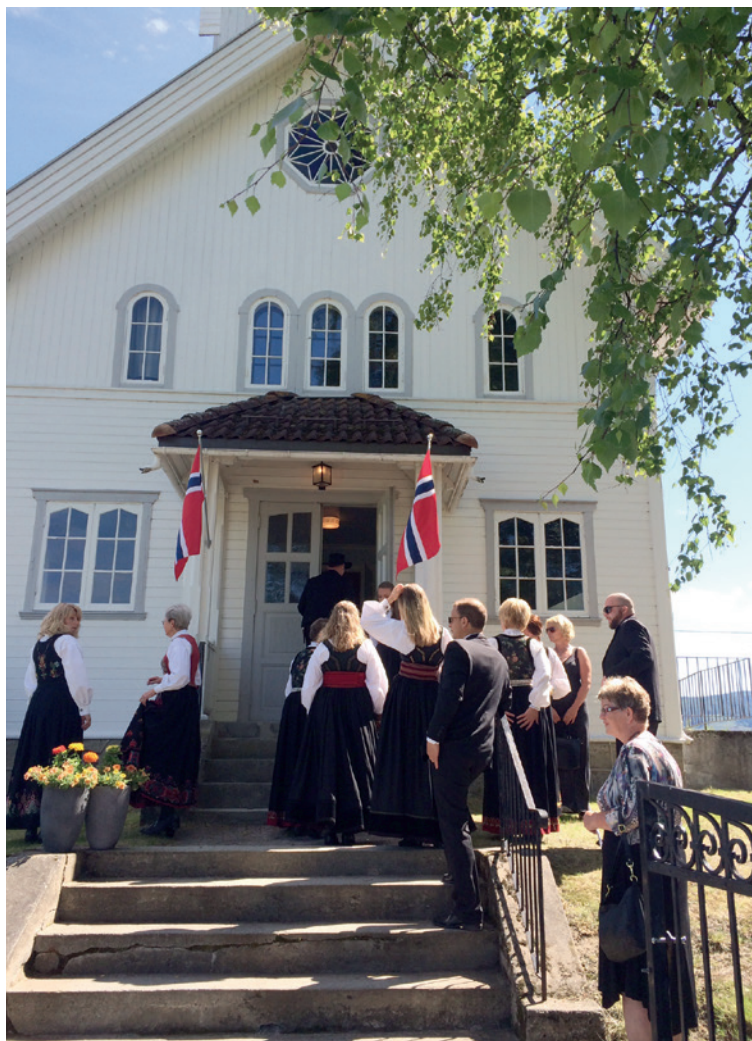
Rud menighetsutvalg har hengt opp nye flagg på kirken til konfirmasjon.