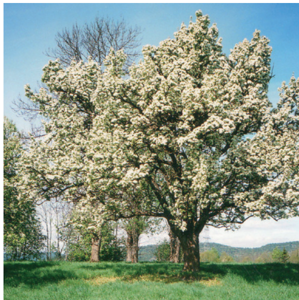
Ett av pergamottrærne i full blomst. I bakgrunn kan vi se nordenden av den gamle allen på Komperud.

Komperud var fra gammelt kapellangård for Nykirke. Opp i gjennom årene har mange kapellaner bodd på Komperud. Og fra 1880 da Vestre Spone kirke ble bygd ble Komperud kapellangård