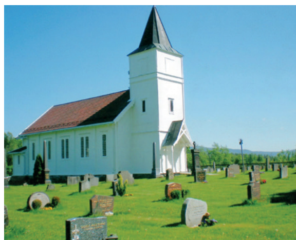
Vestre Spone kirke.

På denne tid har Vestre Spone 800 innbyggere. Året 1878 brakte kirkebygget et skritt videre. 15. mars ble det holdt et møte på en gård i Vestre Spone. Her sa 46 underskrivere at de gikk med på betingelsene. Det var stor trang og det hersket stor glede. De ville låne kr. 2000 privat, så ingen heftelse skulle være en byrde for kirken. Finansiering av bygg og arkitekthonorar ble ordnet. Snart ble klarsignalet gitt for bygging av kirke i Vestre-Sponefjerdingen. Og 18. september 1879 innstiller Kirkedepartementet på at det maa til-lades at der for Beboerne af Districterene Vestre-Sponefjerdingen og Ruds-fjerdingen