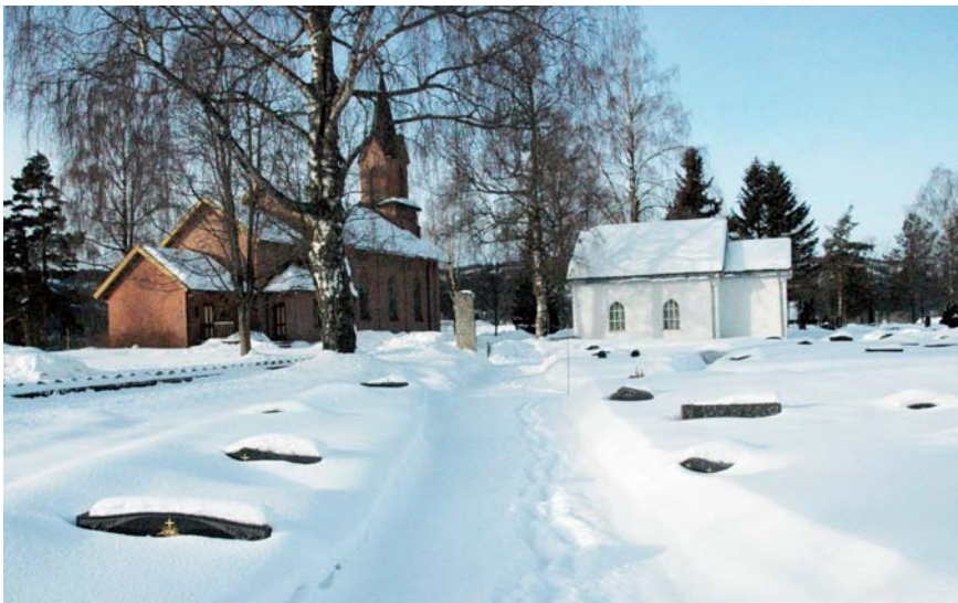
Det er stille på kirkegårdene om vinteren.

I dette nummeret, og de tre neste i 2011, vil det bli skrevet om kirkegårdene i Modum.