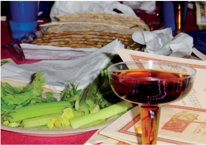
Noe av menyen ved et jødisk påskemåltid i Israel: usyret brød, bitre urter og vin.