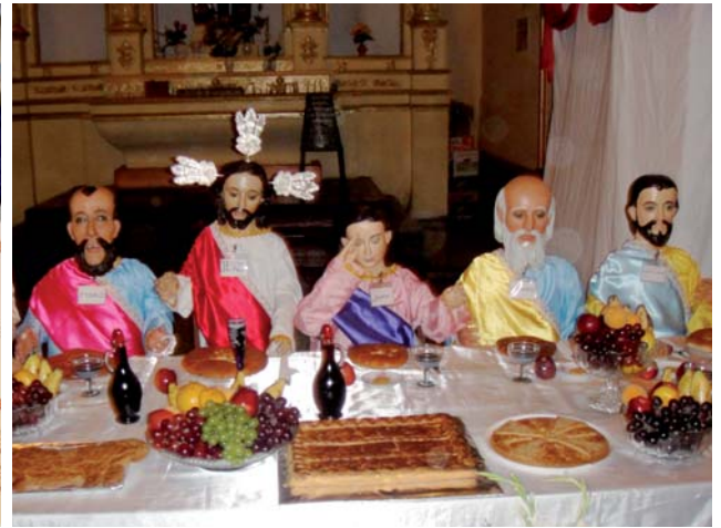
En kirke i byen Catacaos, nord i Peru, oppfører til Påske en «spiselig» oppføring av den siste nattverd. De fattigste fra byen kommer og får maten når Påsken slutter. Mange berører Jesus og disiplene da det sies å bringe lykke.