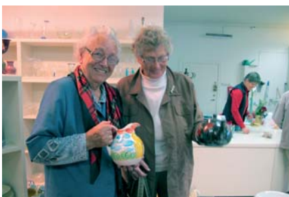
Besøk på gjenbruksbutikken.