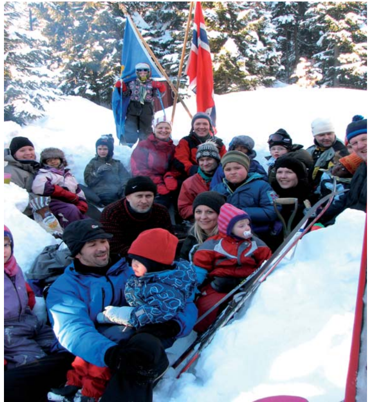
Speiderne samlet på Engersetra en kald, men vakker søndag i februar.