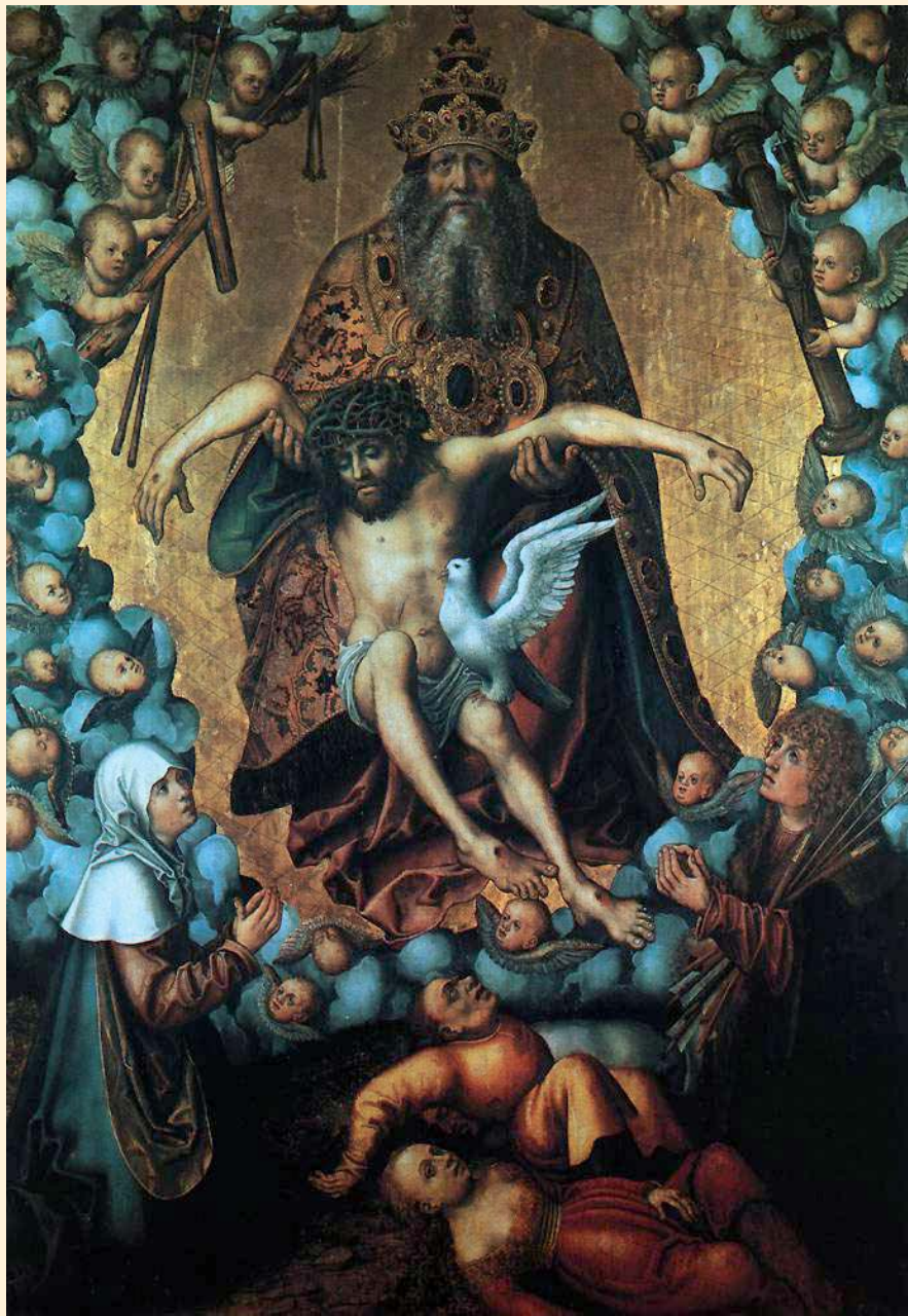
Treenigheten malt av den tyske kunstneren Lucas Cranach d.e. Duen symboliserer Helligånden.