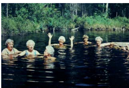
Fra en av sommerturene på 80-tallet.