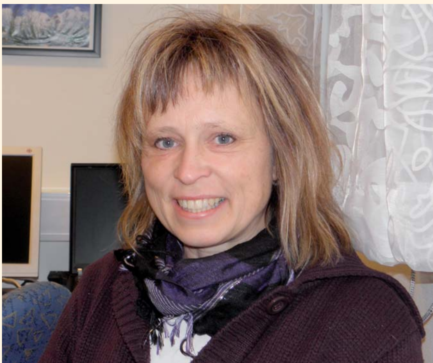
Diakonen er innom kontoret før dagens mange gjøremål.

Ja, mye av det jeg gjør i arbeidet involverer enkelte i staben her. Jeg kan nevne arrangementet vi har Allehelgensdag for pårørende til de som døde i menigheten siste året, og brudeparkvelden for alle som skal gifte seg i Modum menighet. Påskevandring for grupper som ønsker det i barnehager og skoler må heller ikke glemmes. Så deltar absolutt alle i staben på Frivillighetsfesten. Da inviteres alle de 300 personene som er involvert i menighetens arbeid, så vi ansatte kan gjøre litt stas på dem. Selv