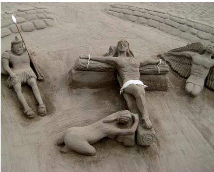
Påskens budskap, Torremolinos, Spania.