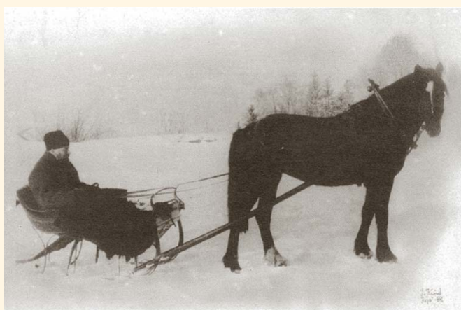
Amlund med hest og slede.

å nevne at til langt fram mot vår tid foregikk hele begravelsesseremonien på kirkegården. Slektninger og andre som fulgte den døde gravde opp graven og senket kisten i jorden. Så ble presten tilkalt. Han leste over den døde og foretok jordpåkastelsen. Deretter kastet deltakere i gravfølget graven igjen.