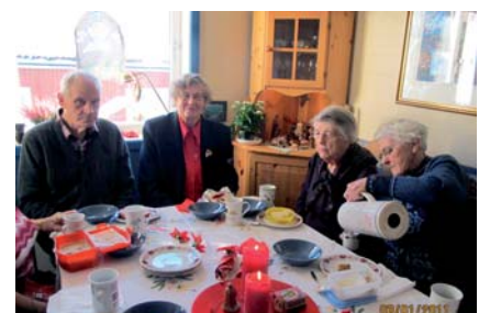
Møtene er rundt i hjemmene.