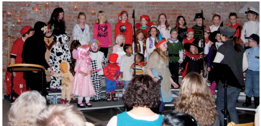
Karnevalsgudstjeneste på Vingårdssøndagen.