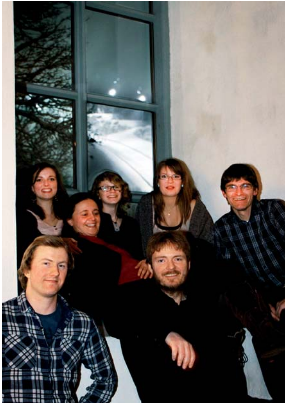
Kirken tok sats og bidro til folkefesten med "Åpen kirke", Gospelnight og Worldcup gudstjeneste. Worldcup gudstjeneste. Heggen Gospel og Madcon varmet opp publikum med sangen "Glow" i bakken.