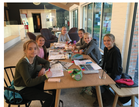
En leksegjeng har slått seg ned i kafeen.