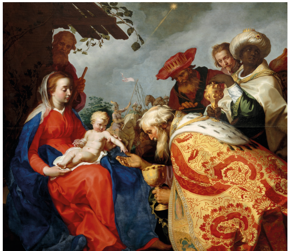
Abraham Bloemaert: The adoration of the Magi

Endel av fortellingene om vismennene har nok ikke veldig solid grunnlag i historiske fakta. Men om de ikke nødvendigvis sier oss så mye om hvem vismennene faktisk var, er fortellingene tidlige vitnebyrd om hvordan Jesu fødsel ble forstått i den første kristne kirke. De setter Jesu fødsel inn i en historisk kontekst: Jesus var en konge, verdt å tilbe som Gud. Og han var ikke bare en konge for jødene, men for hele verden.