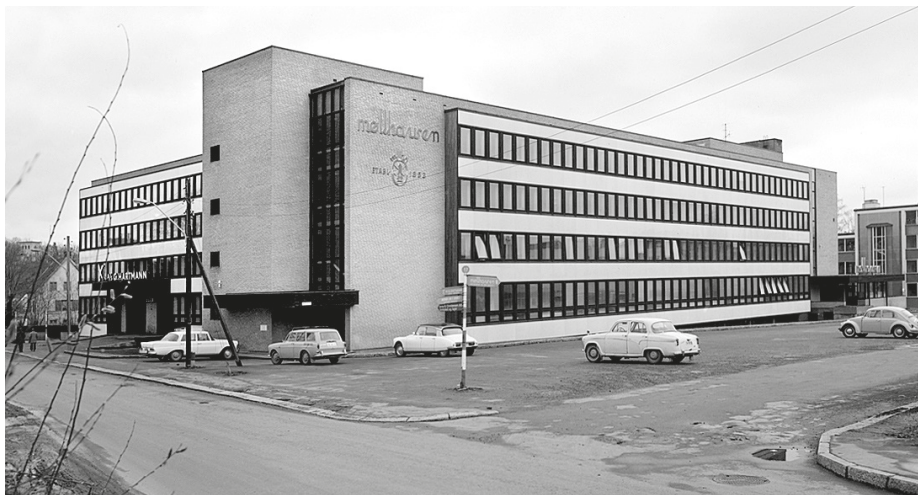
Fabrikken sett fra Hoffsvæien i 1969.

Industrialisering av bakeriene lå i tiden fra Kneippfabrikken på Tøyen startet i 1910, Martens i Bergen fulgte etter og giganten Kristiania Brødfabrikk åpnet i Rosenborgkvartalet i 1929. Møllhausen ville ikke være dårligere, og skaffet seg en tomt på