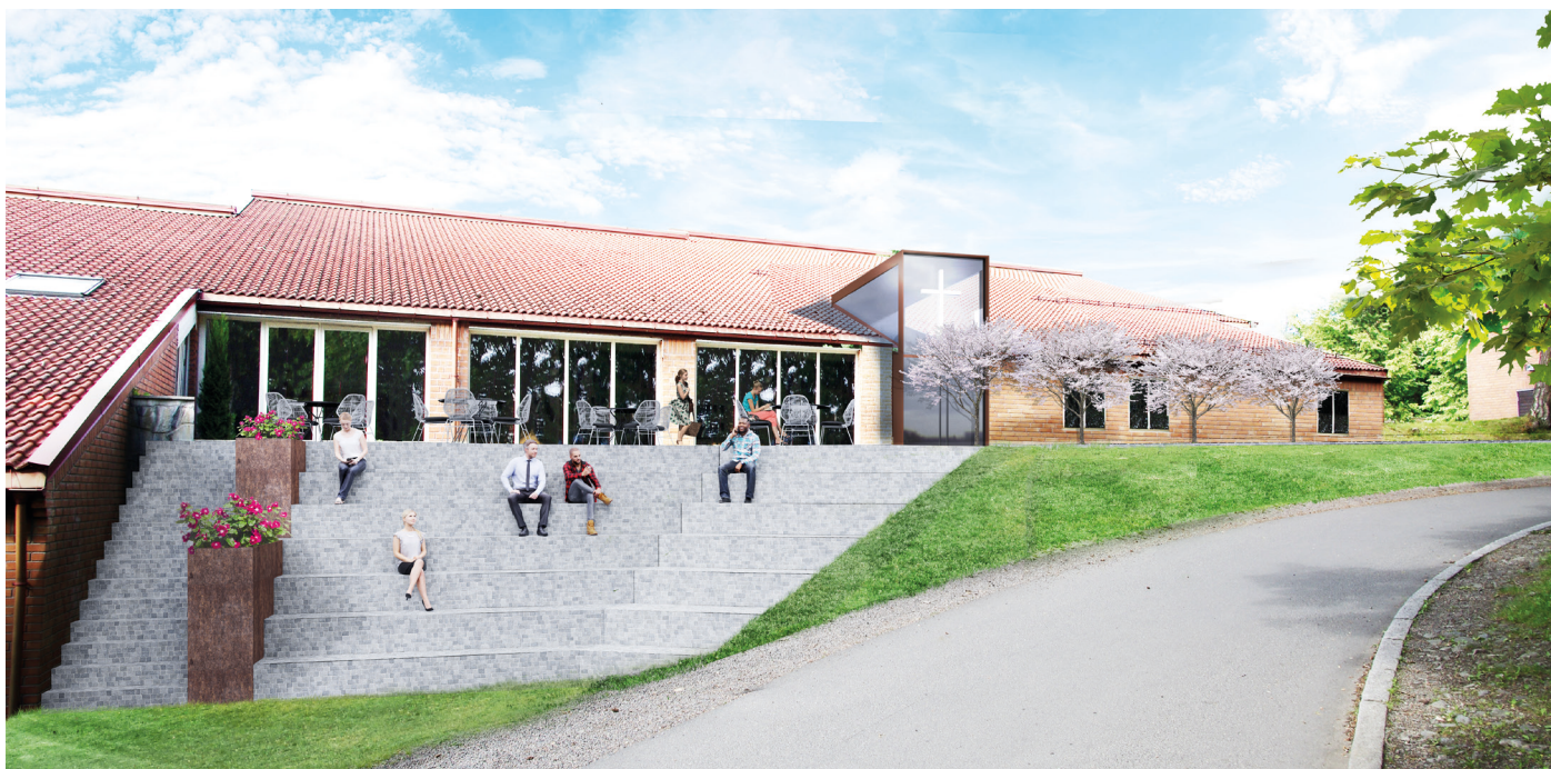
Illustrasjon fra en tidligere fase i prosjektet. Bildet avviker noe fra de endelige planene.