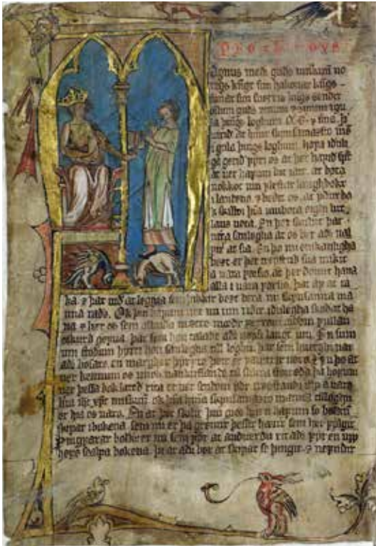
Prolog til Landsloven fra Codex Hardenbergianus.

forma for slaveri avskaffa. Fedre og brødre si makt over kvinner vart redusert, og ei kvinne skulle etter kvart til dømes samtykkja ved ekteskap. Den rike si makt over den fattige vart redusert, og etter kvart fekk ein innført ei almisseplikt. Og hemnetten, sjølve grunnpilaren i rettsystemet, vart erstatta av kongen si plikt til å sikra Guds fred».