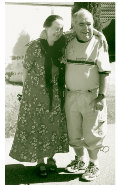
Vennskap knyttes og styrkes.