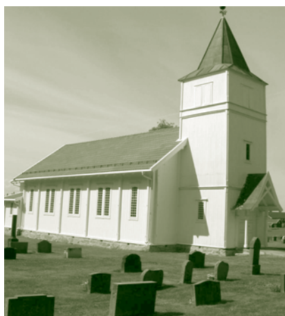
Vestre Spone kirke.

18. september blir det Jubileumsgudstjeneste i kirken kl. 11.00. Etterpå vil det bli samling på grendehuset Gimle.