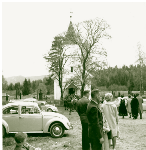
I mange år var det tradisjon å gå i tog til kirken den 17. mai fra Jelstad skole. Stor stas var det da hornmusikken begynte å bli med i toget fra sist i 1950-åra. På 17. mai var kirken fullsatt.