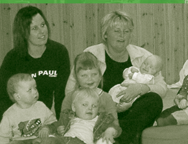
Småbarnstreff side 8