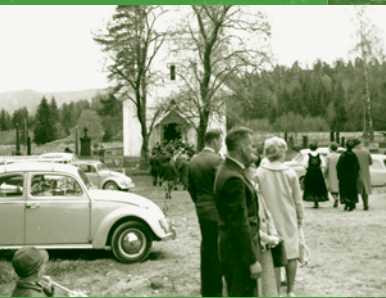
Vestre Spone kirke side 6