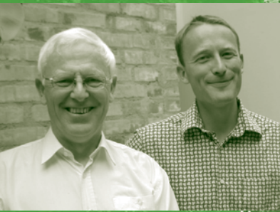
Rollebytte side 3