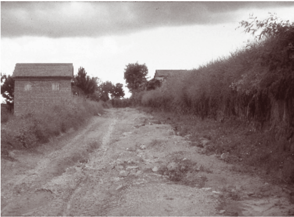
Veistandard på Madagaskar.