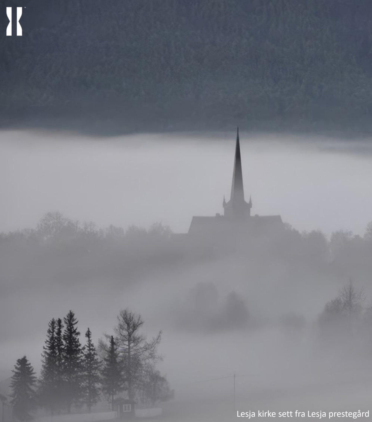
Lesja kirke sett fra Lesja prestegård