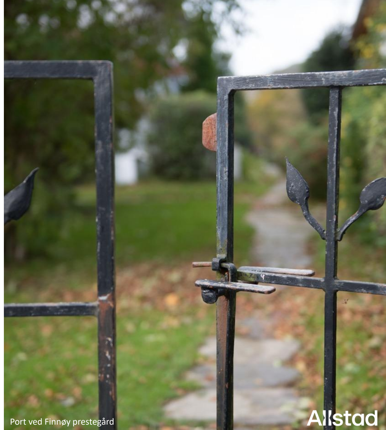
Port ved Finnøy prestegård