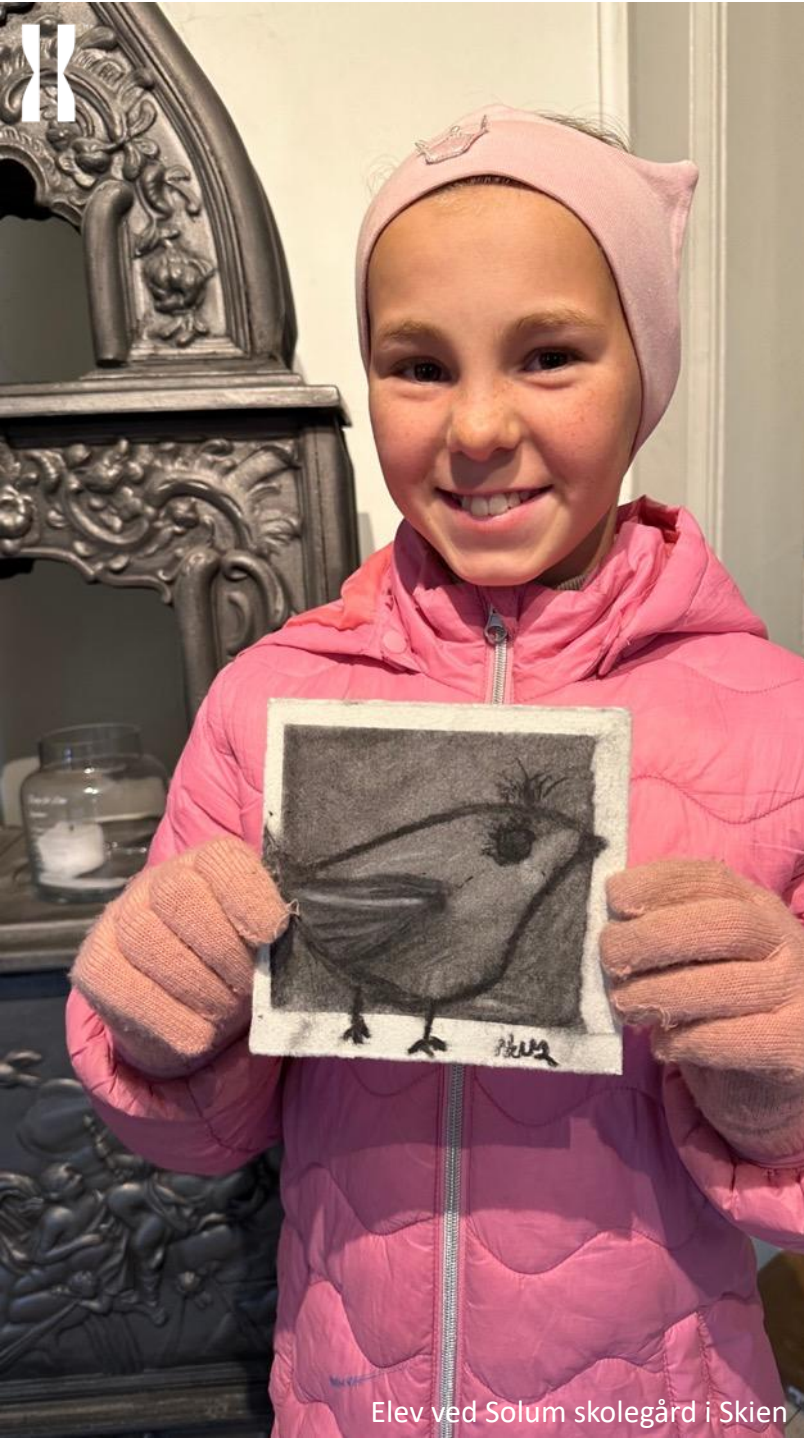
Elev ved Solum skolegård i Skien