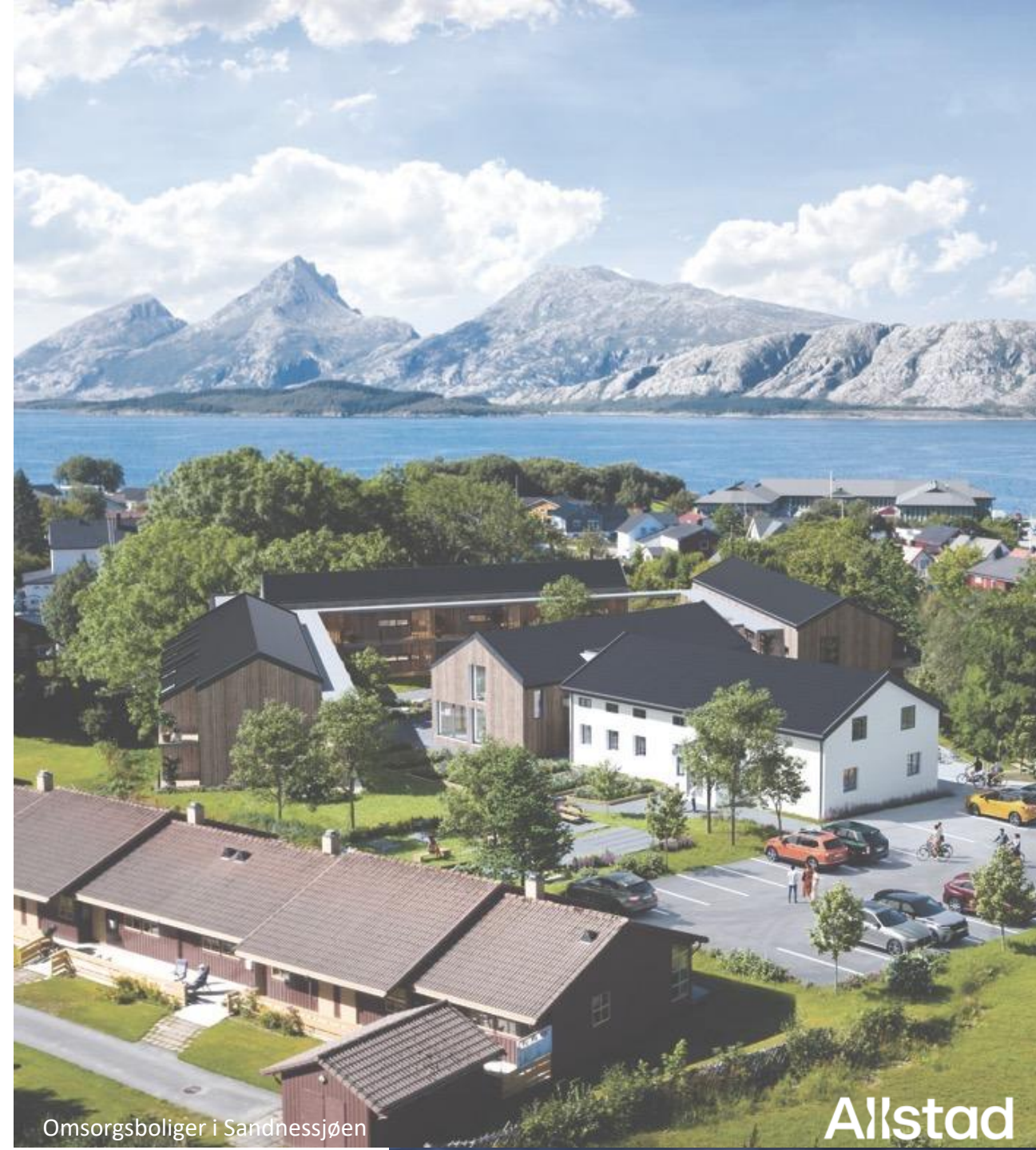
Omsorgsboliger i Sandnessjøen