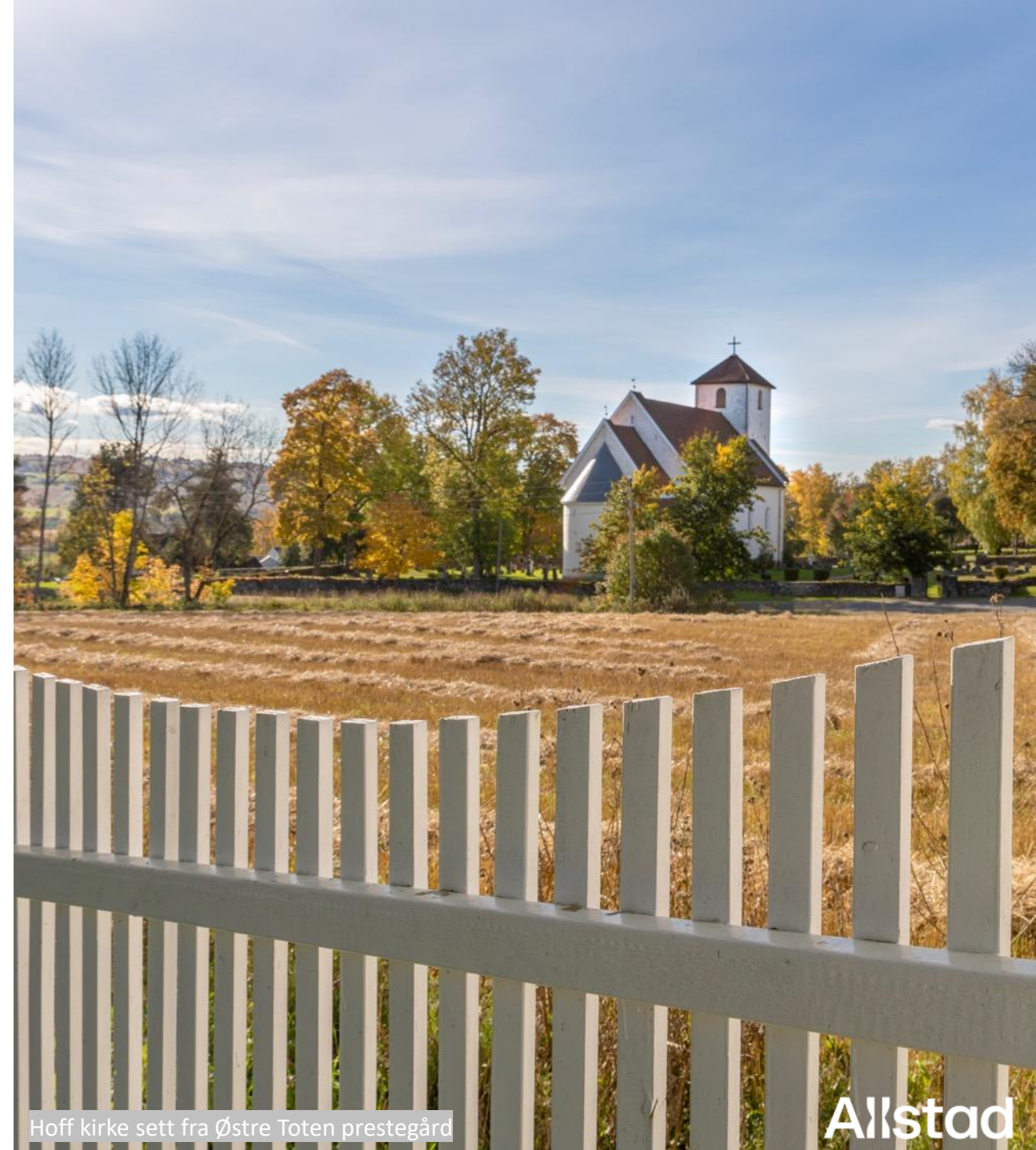
Hoff kirke sett fra Østre Toten prestegård