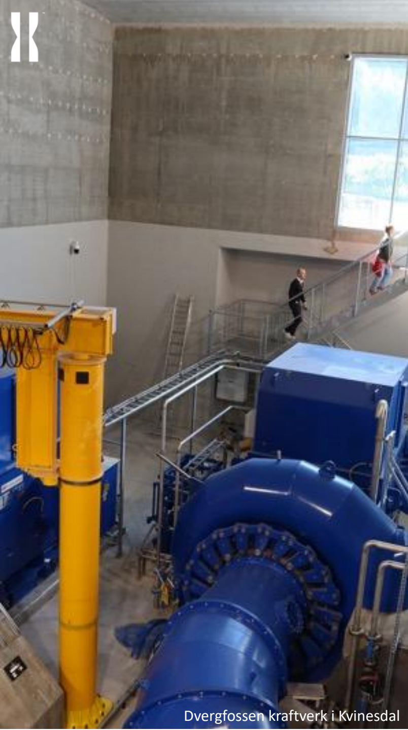
Dvergfossen kraftverk i Kvinesdal