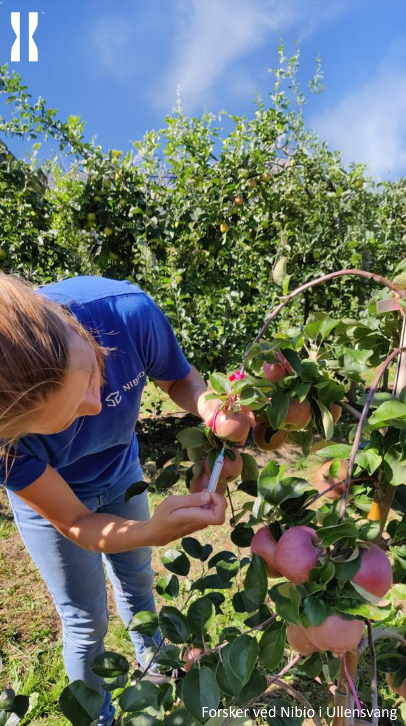
Forsker ved Nibio i Ullensvang