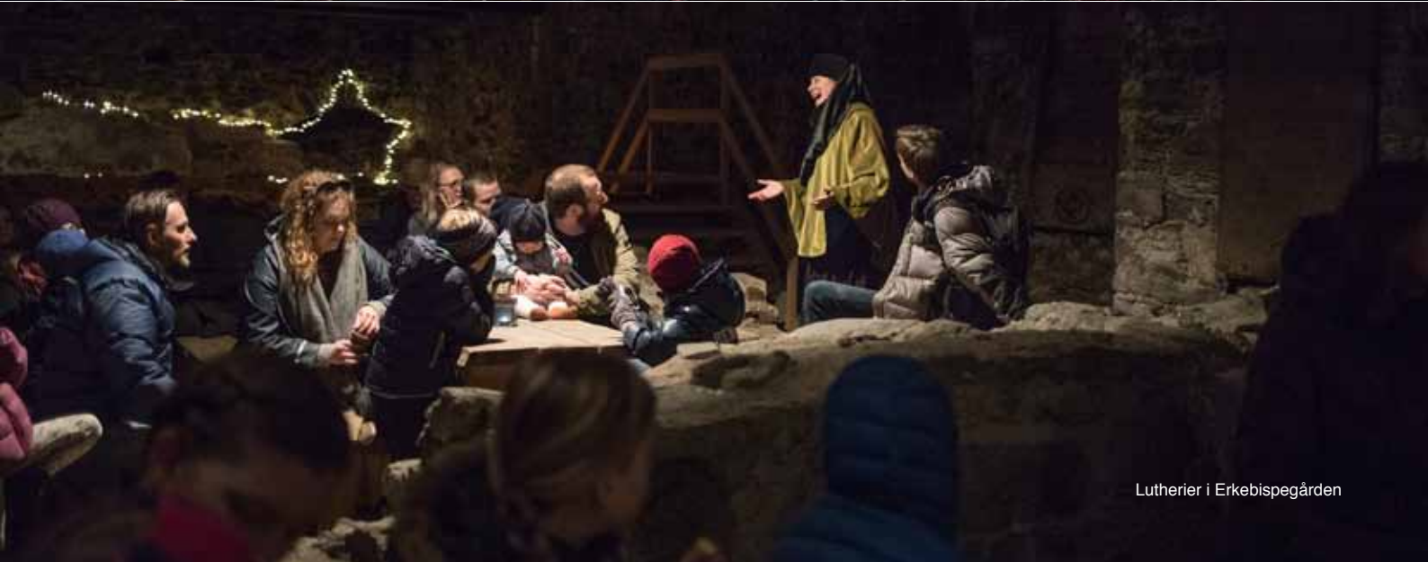
Lutherier i Erkebispegården