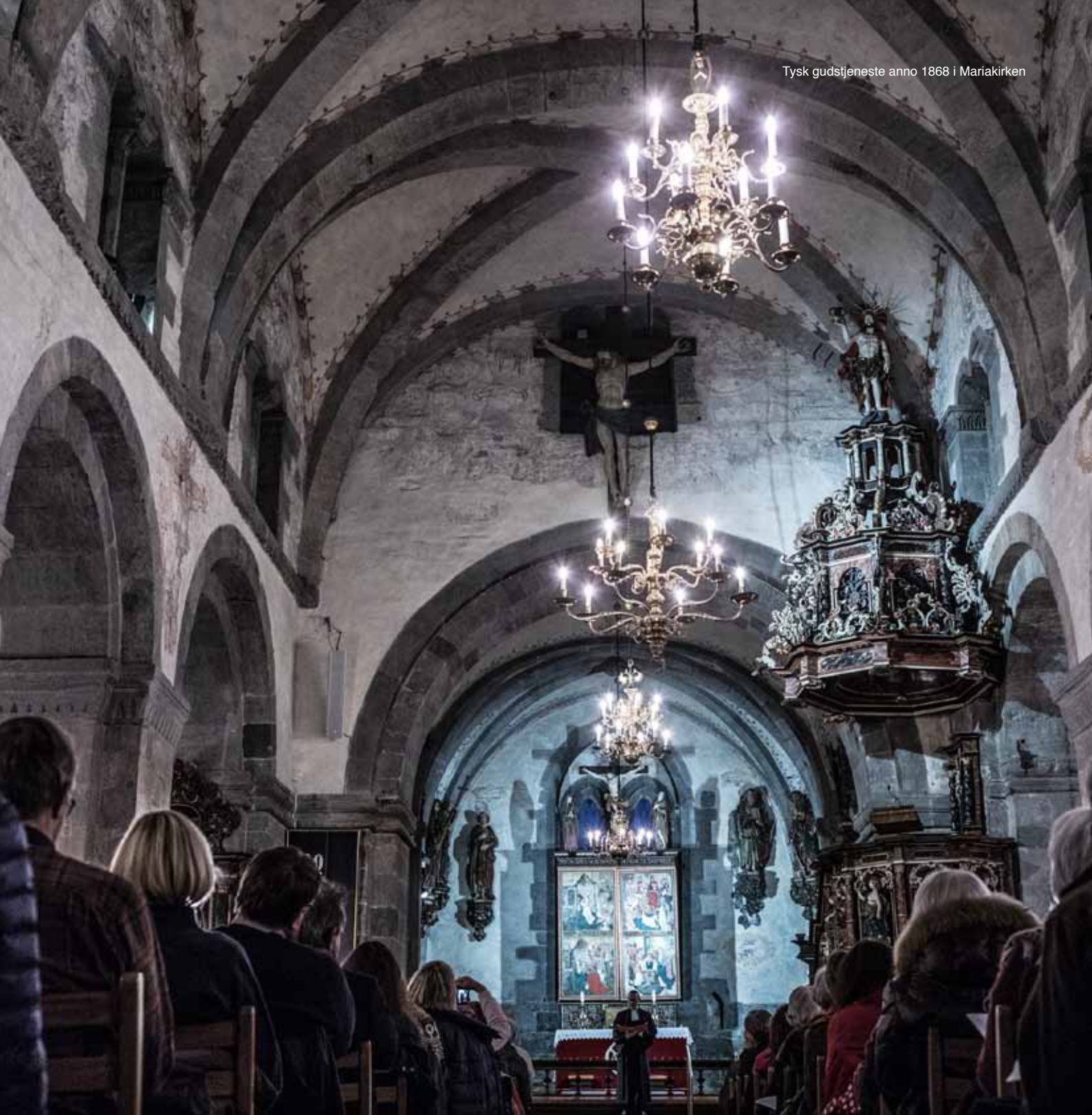
Tysk gudstjeneste anno 1868 i Mariakirken