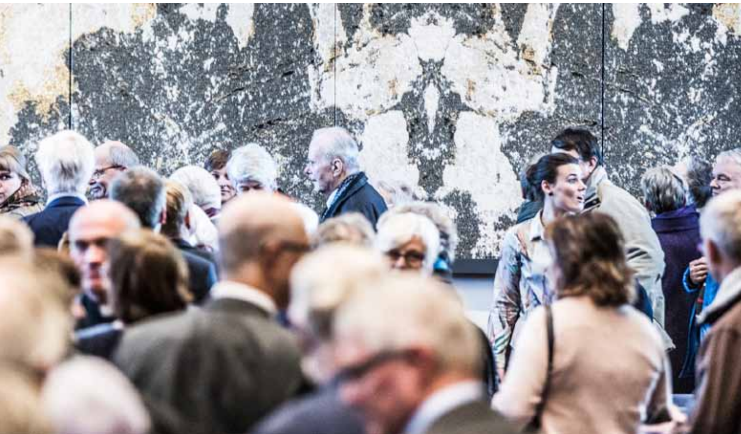
Fra pausen - Luthersamtalen i Universitetsaulaen