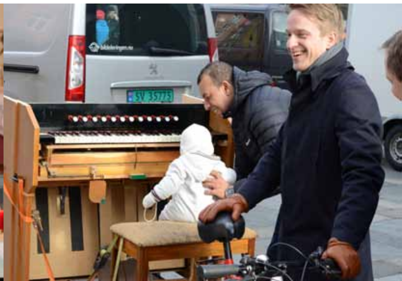
En testtur av salmesykkelen