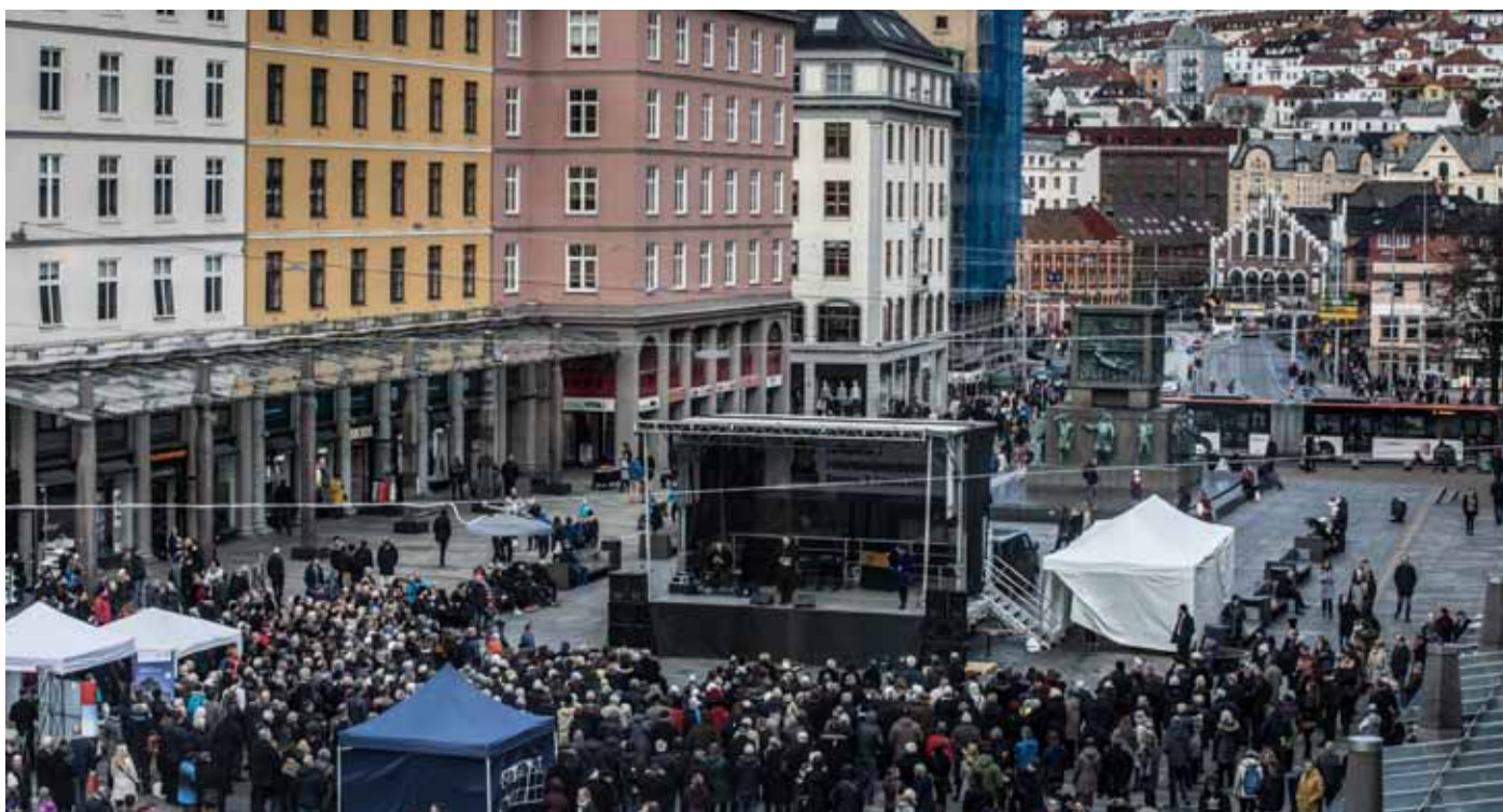
Høytidelig åpning av Folkefesten midt i byens storstue