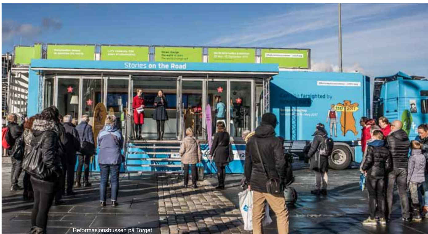
Reformasjonsbussen på Torget