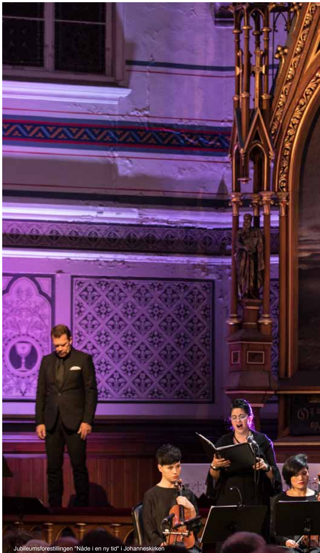
Jubileumsforestillingen "Nåde i en ny tid" i Johanneskirken

Festgudstjenesten i Domkirken med 800 tilstede, var vidunderlig og uforglemmelig, med Bachs Reformasjonskantate nr. 80, taler og hilsener på flere språk og en salmesang av de sjeldne.