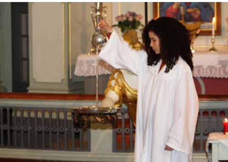
Konfirmant heller dåpsvatn i Nykirken.