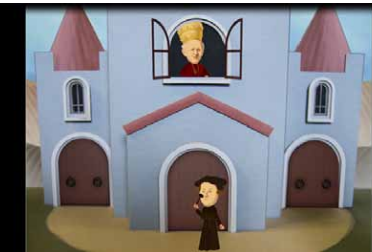
Fra vignetten som introduserer ukens tese på tårnet til Johanneskirken (Design: Studenter ved Institutt for design ved fakultetet for kunst, musikk og design, UiB)