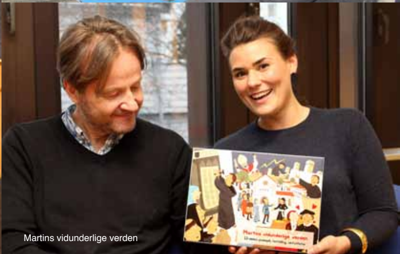
Martins vidunderlige verden