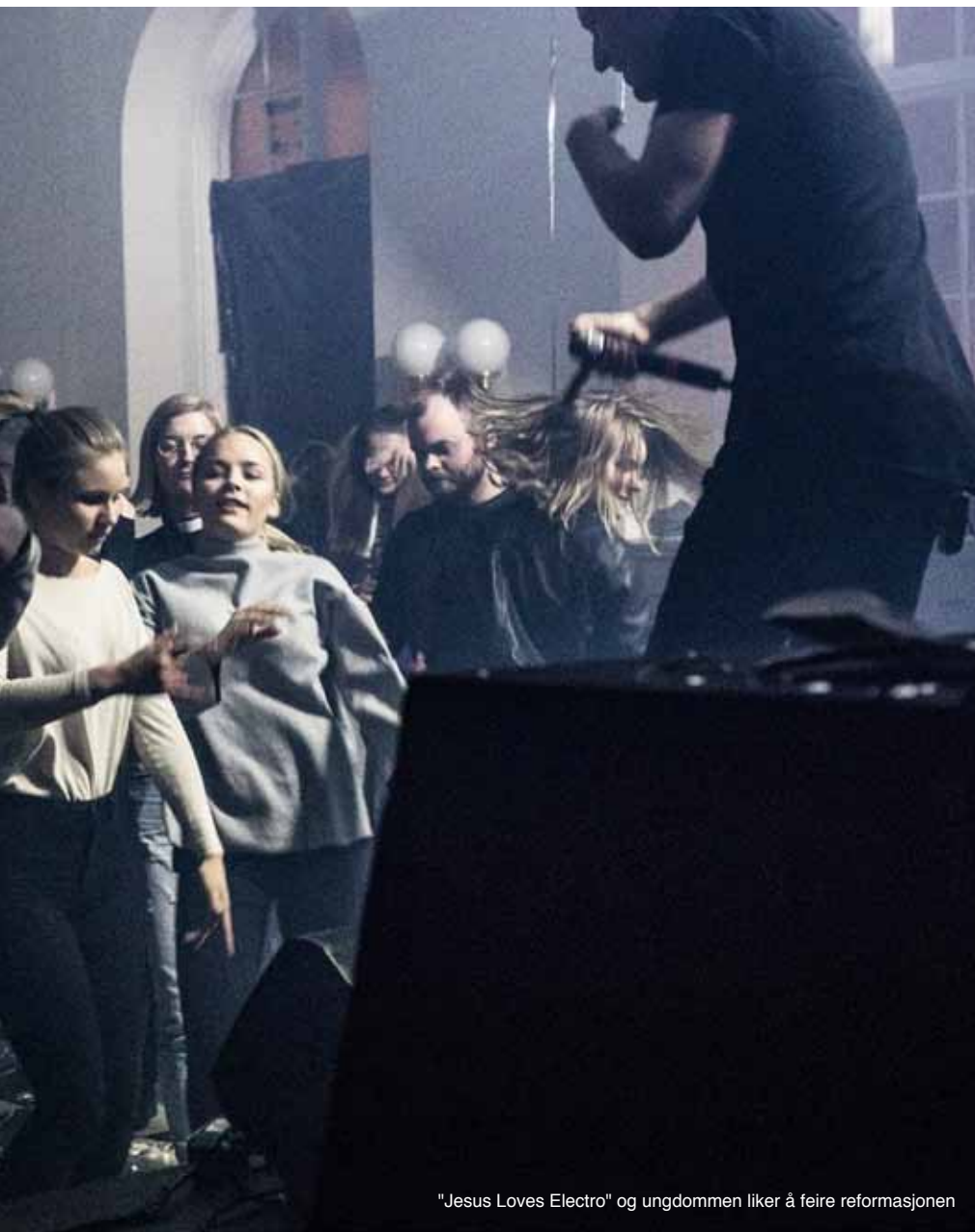
"Jesus Loves Electro" og ungdommen liker å feire reformasjonen

Det var mulig å klatre til topps i to ekte tårn under vandringen: i Nykirken og Korskirken. Det store oppmøtet til 7-tårnsturen var uventet og gledelig. Vi ser et stort potensiale for etterbruk av Martins vidunderlige verden og 7-tårnsturen, både for skolene og turistene i Bergen og for trosopplæringen i kirkene i Bergen.