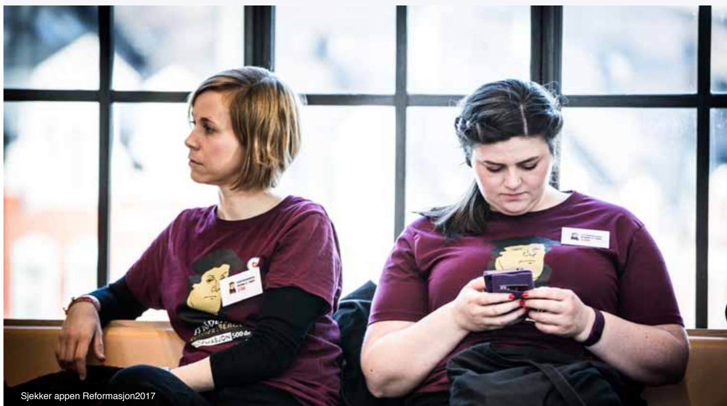
Sjekker appen Reformasjon2017

Reformasjonsåret 2017 vil bli markert over hele verden i et økumenisk fellesskap, i academia og samfunnet for øvrig.