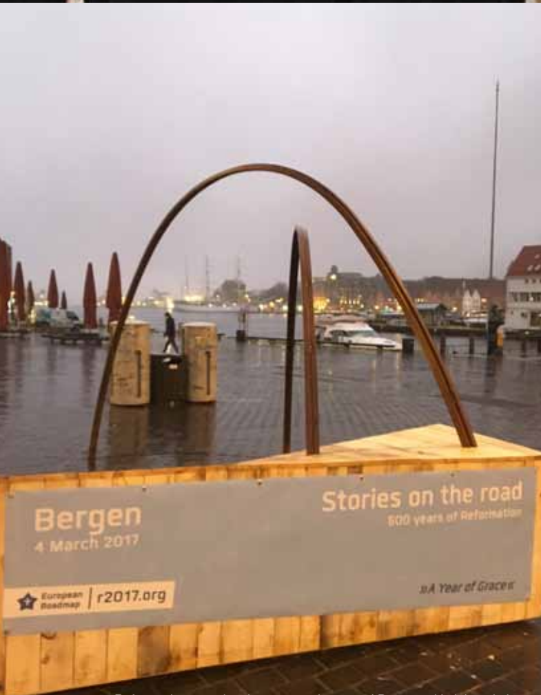
Reformasjonsportalen, laget av studenter ved Bergen arkitekt hogskole