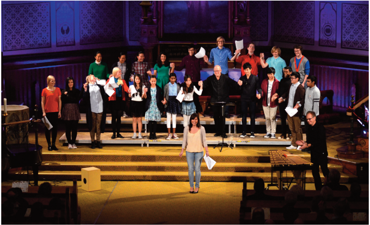
Stor stemning under Kyrkjemusikkfestivalen for ungdom i Johanneskirken.