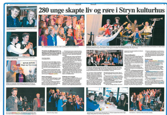
Faksimile frå Fjordingen i forbindelse med KFUK-KFUM Sogn og Fjordane sitt Vintertreff i Stryn i februar.

Biskopen var i februar til stades på Bjørgvin KFUK-KFUM sin Vinterfestival på Voss, og KFUK-KFUM