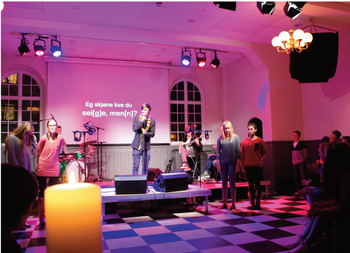
Torsdag kveld i St. Jakob.