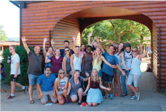
Frå turen til Taize i august.