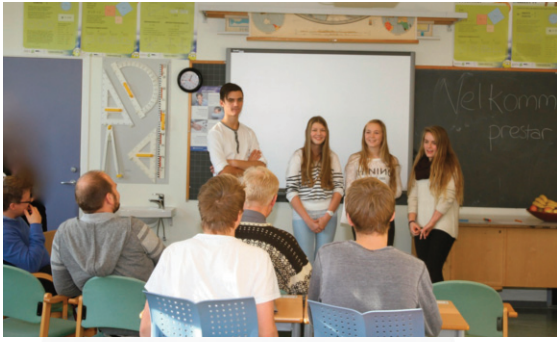
Prestar kursa av 10. klassingar i ungdomskultur.