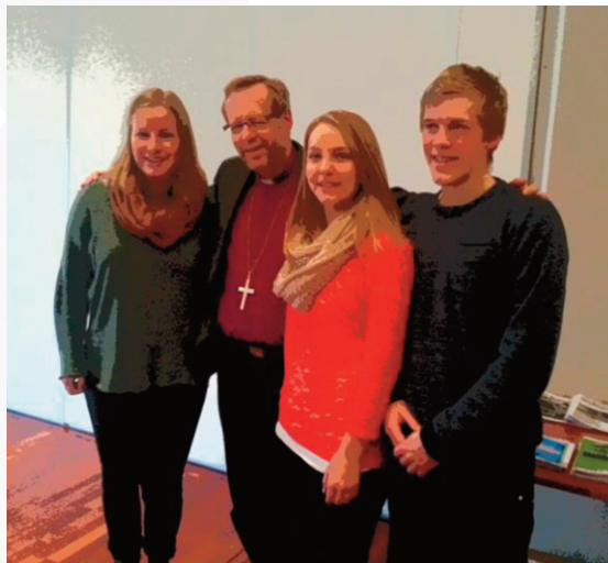
Biskopen og ungdom i Førde i Sunnfjord.

For å få fleire til å tenka gode tankar om prosjektet vart det, hausten 2011 og våren 2012, arrangert fleire møte med ei referansegruppe som hadde representantar frå dei ulike kristne barne- og ungdomsorganisasjonane, NLA høgskulen og Ungdomsrådet i Bjørgvin bispedøme. Organisasjonane som var med var KFUK-M Bjørgvin og Sogn og Fjordane, NLM ung, NMSU, IMF ung, Acta, KRIK Hordaland, Ung Kirkesang. Einskilde ungdomsarbeidarar og ungdomsprestar var óg med på desse møta.