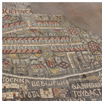
Mosaikken i Madaba

Amman - Petra - Wadi Rum - Madaba - Mt Nebo - Betania - Betlehem - Jerusalem