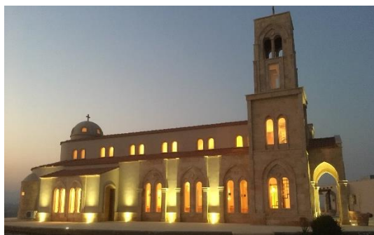
Lutherske kirken ved Jordanelven