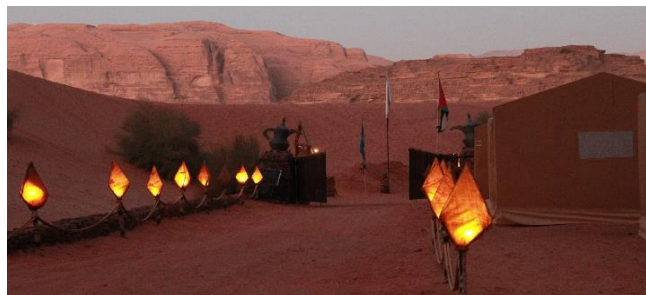
Leiren i Wadi Rum