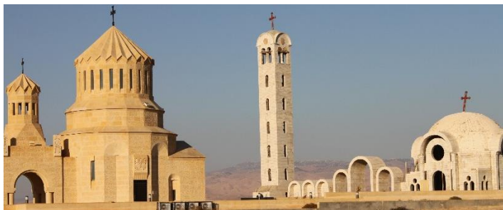
Betania ved Jordan-elven

Frokost i herberget. Formiddagen tilbringes på egenhånd i Betlehem eller Jerusalem før vi setter kursen mot flyplassen i Tel Aviv. Avreise med Austrian Airways kl 1610 til Wien, ankomst kl 1900. Samme flyselskap tar oss videre kl 20.30, og vi lander på Gardermoen kl 22.55.