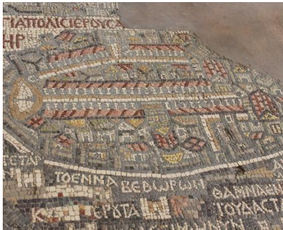
Mosaikken i Madaba

Amman - Petra - Wadi Rum - Madaba - Lots cave - Mt Nebo - Betania - Betlehem - Jerusalem