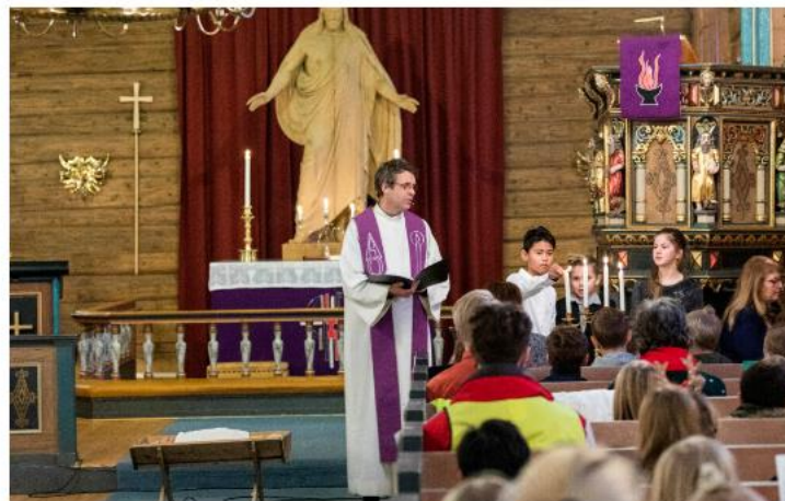
Illustrasjonsbilder fra skolegudstjeneste i Leinstrand kirke.

Kirken mener det kan oppstå unødvendig dobbeltregulering og uklarhet rundt skolegudstjeneste dersom det innføres forbud mot forkynnelse i skolen.