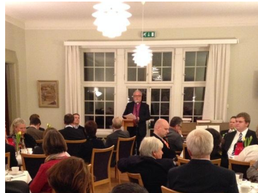
Fra biskopens nyttårsmottagelse