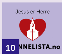
10 NNELISTA.no Thea Aarseth