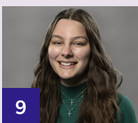
9 Cornelia Bernadotte Nordenstam