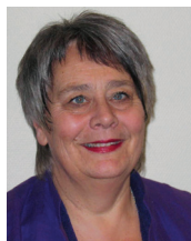
Solveig Fiske Biskop Hamar Bispedømme