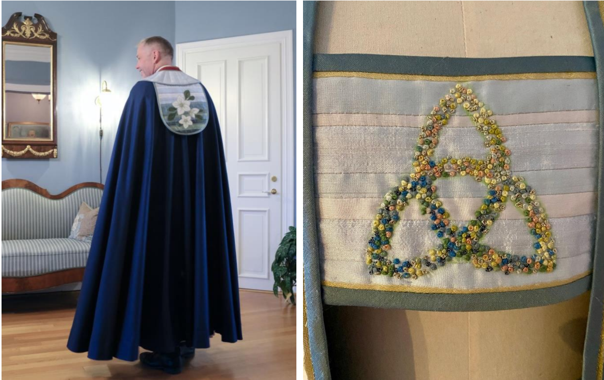
Skjoldet bak med blomsten Olavsstake som motiv, og treenighetssymbolet på brystspennen.

Valget falt på fargen blå som hovedfarge på kappen med et ellers enkelt symbolbruk. Med et fragmentert uttrykk med inspirasjon fra bispedømmets varierende landskap på stolpene, skjoldet og brystspennen liggende som en bakgrunn, ble blomsten Olavsstaken valgt som symbol på skjoldet bak og treenighetssymbolet som symbol på brystspennen foran.