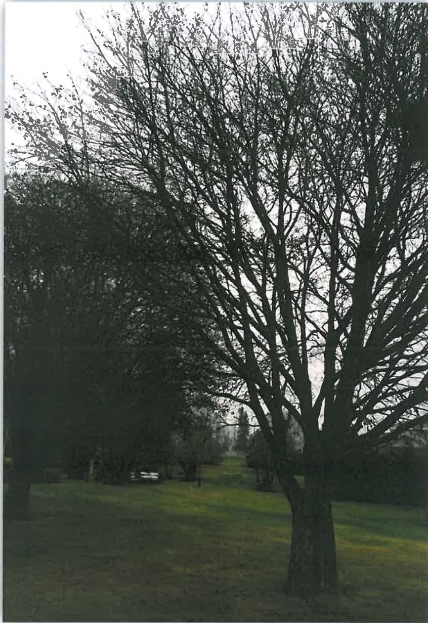
November på Hadeland.