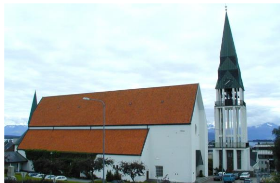
Molde domkirke, 1957