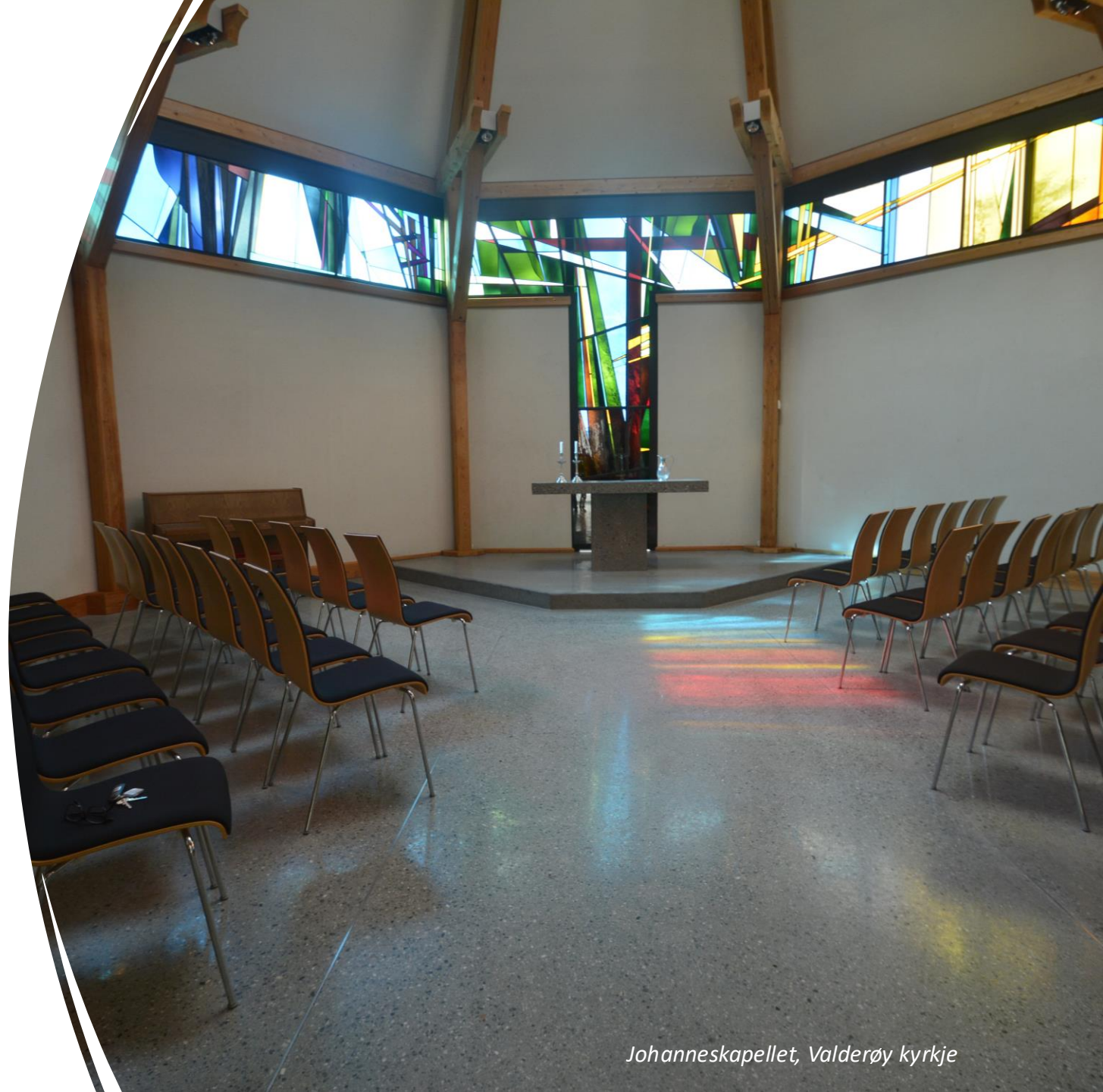
Johanneskapellet, Valderøy kyrkje

Stemshaug, Kornstad, Langøy kapell, Eide, Hustad, Myrbostad, Valderøy, Gjemnes, Osmarka kapell, Brattvåg, Hamnsund, Vatne, Fjørtoft, Indre Herøy, Herøy, Otrøy, N-Heggdal kapell, Røbekk, Sekken, Eikesdal, Nettet, Vistdal, Holm, Øverdalen, Vågstranda, Gursken, Larsnes, Edøy nye kirke, Liabygda, Langevåg, Ellingsøy, Spjelkavik, Dalsfjord, Kilsfjord, Bjørke, Vartdal, Ranes, Todalen, Øye, Sykkylven, Straumsnes, Vanylven, Åram.