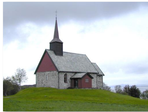
Edøy gamle kyrkje, 1190