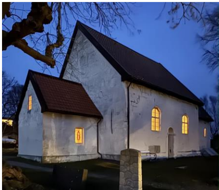
Giske kyrkje, 1130