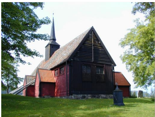
Kvernes stavkyrkje, 1600