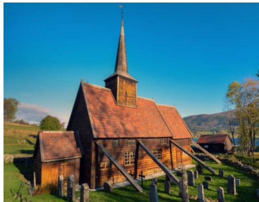
Rødven stavkyrkje, 1300