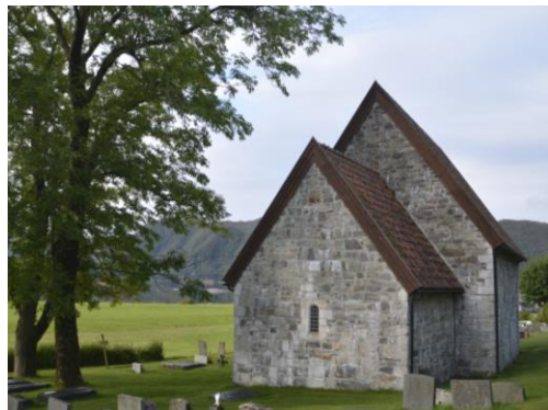
St. Jetmunds 1150