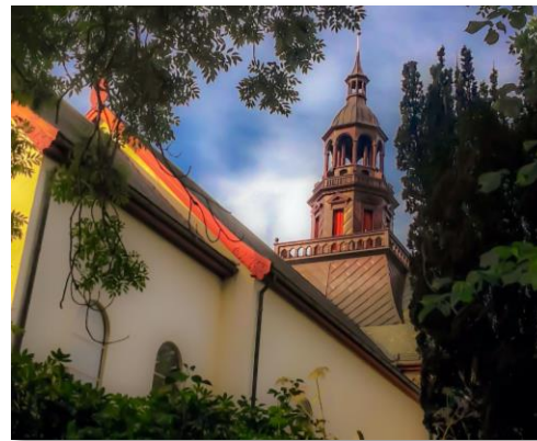
Borgund kyrkje, 1300