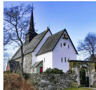
Tingvoll kyrkje, 1200