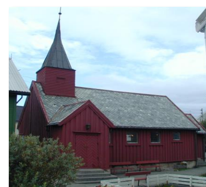
Grip stavkyrkje, 1470