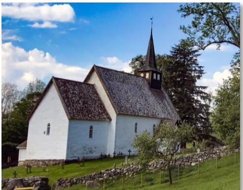
Veøy gamle kyrkje, 1200