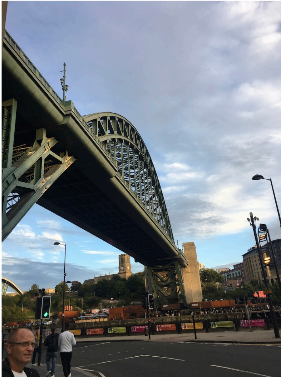
På besøk i Newcastle sentrum.