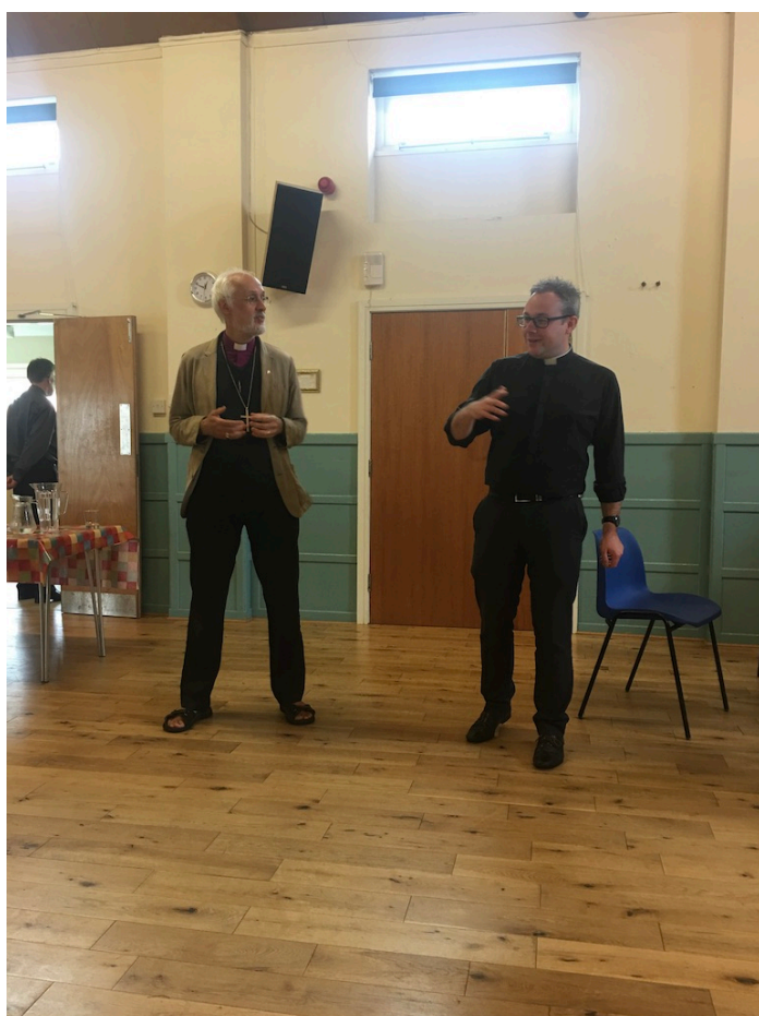
«Hot Potatoes»: Grill en biskop om dagsaktuelle spørsmål under kirkekaffen