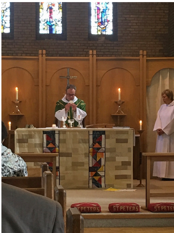
Nattverdfeiring i St Peters