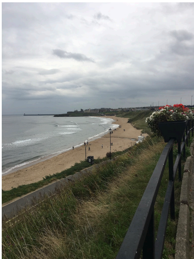
Strandområdet i Whitley Bay