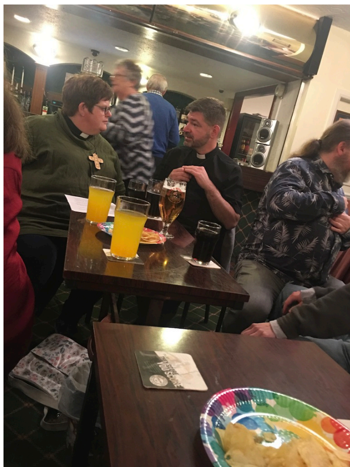
Prestekolleger fra Manchester