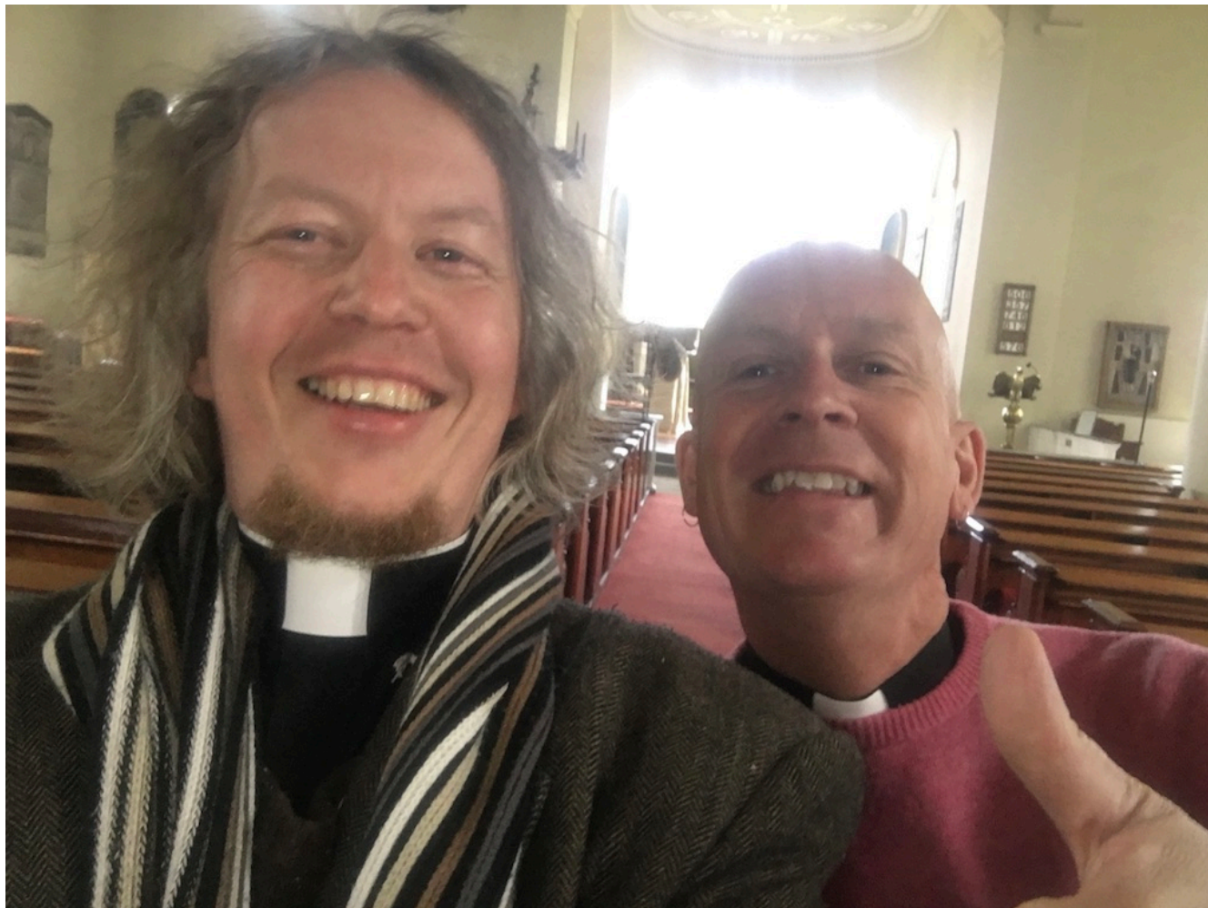
Blide sokneprestkolleger på tvers av kirker.