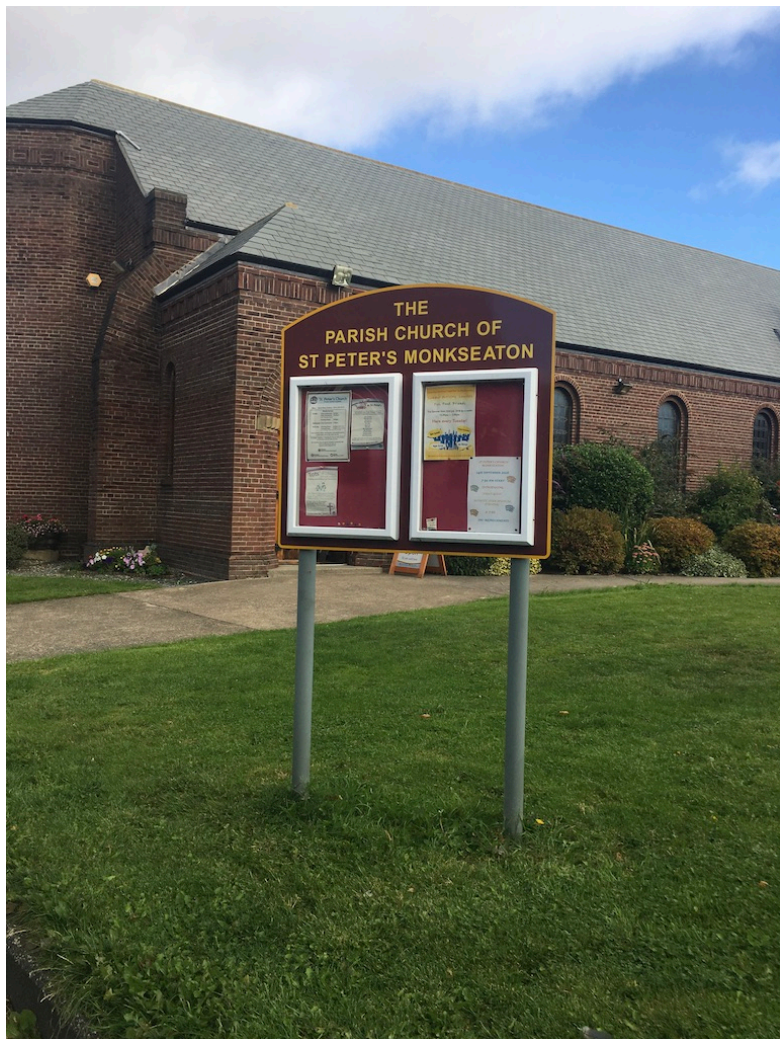
Soknekirken: St Peter`s Church in Monkseaton