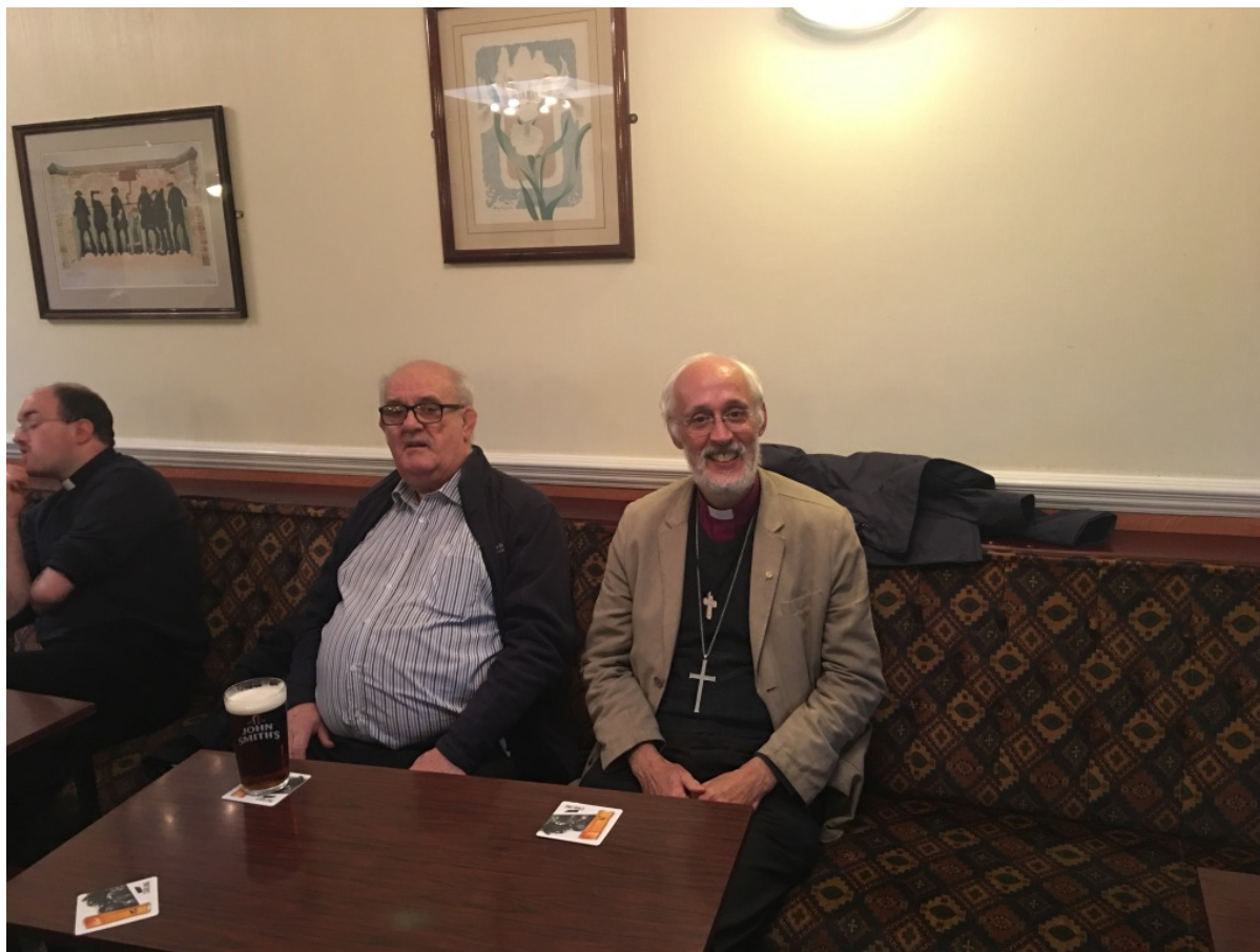
Biskop på pub