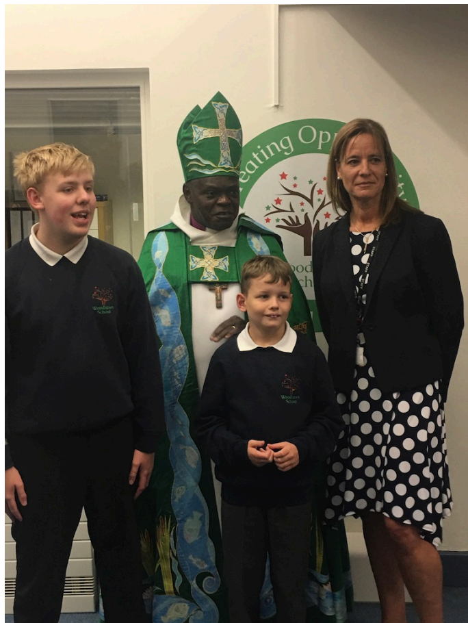
Erkebiskop Sentamu på Woodlawn School