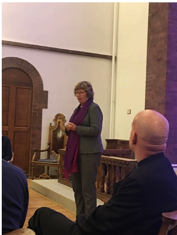
Biskop Ingeborg snakker om sin bispetjeneste i Møre