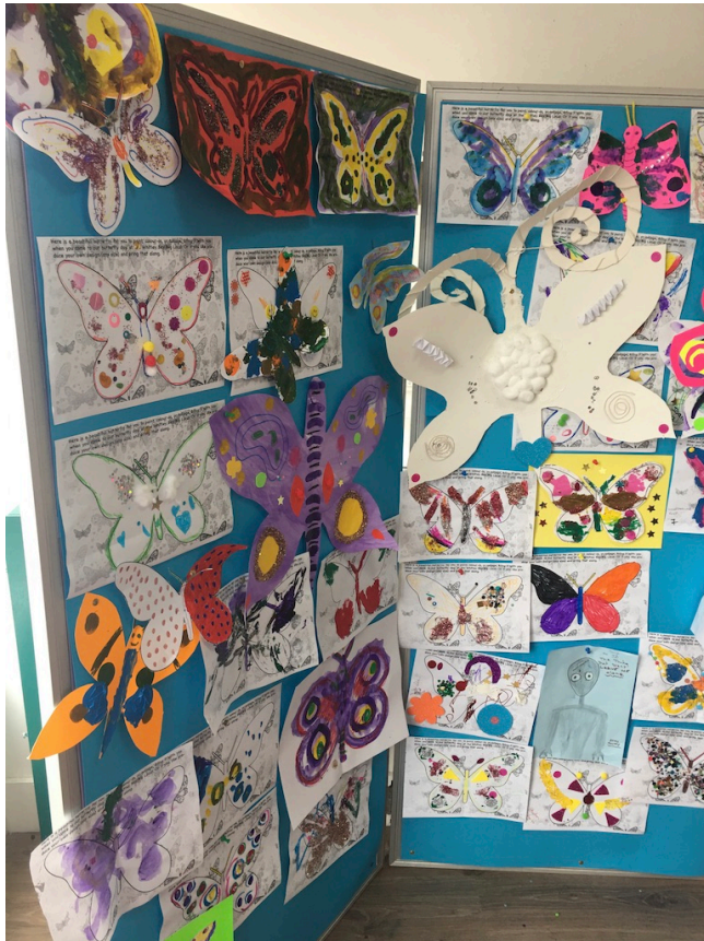
«Butterflies for hope»