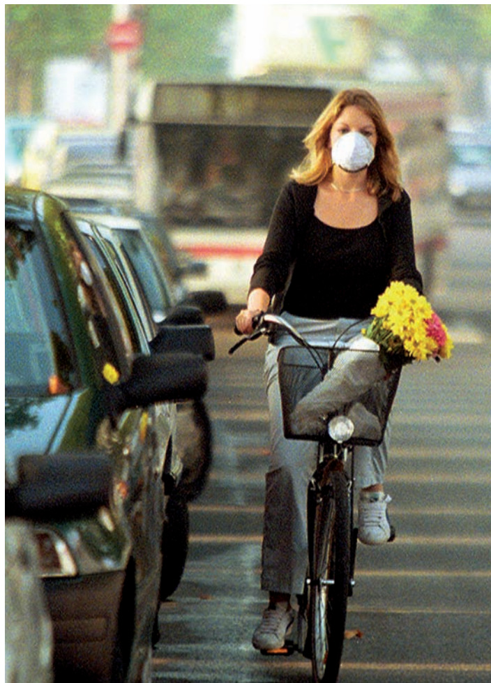
Miljøspørsmålene utfordrer kirkenes diakonale virksomhet.

Menneskelivet og menneskeverdet skal vernes fra livet begynner til det ender. Kirken må derfor være en kritisk røst i forhold til dagens abortpraksis, kjempe mot sorteringssamfunnet og aktiv dødshjelp, og engasjere seg i de store etiske problemstillingene som bioteknologien reiser. I tillegg møter diakonien de konkrete utfordringene fra disse områdene på det mellommenneskelige plan. Det finnes organisasjoner som arbeider spesielt med dette. Menigheten lokalt kan jobbe med disse emnene gjennom etisk refleksjon, sjelesorg og praktiske omsorgsoppgaver, for eksempel barnevaks- og støttekontaktordninger.