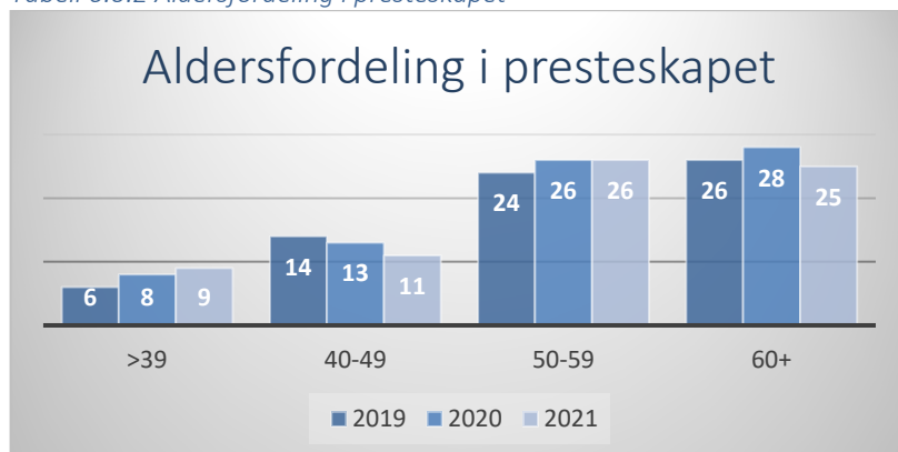
Tabell 6.0.2 Aldersfordeling i presteskapet

Bispedømmerådet og biskop har også i 2021 hatt fokus på å beholde og rekruttere. Samtaler rundt motivasjon og individuell tilrettelegging gjennomføres hele året, og spesielt i medarbeidersamtaler. I samarbeid med prost ønsker bispedømmerådet å være konstruktiv og strekker seg langt for å beholde ansatte så lenge som mulig. Søknader om delvis AFP vurderes i hvert enkelt tilfelle og innvilges der det er mulig. I 2021 var det én prest som fikk innvilget 20 % AFP i sin stilling.