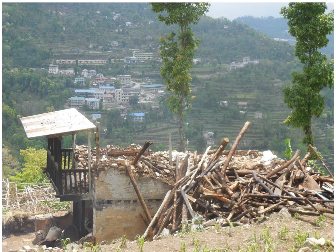
Slik ser det ut her. Et av de jordskjelv-skadde husene foran, med sykehuset i bakgrunnen.

Jordskjelvet må bli hovedtema, og vi tar det viktigste først: Folket her trenger hjelp, nå. I Okhaldhunga er det ikke så store skader på liv og helse som i andre deler av Nepal. Men det er store skader på alle slags bygninger.