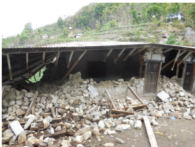
En av de sammenraste skolene.

Det er omtrent bare dørene som står igjen. Pultene var begravet under stein fra veggene. Enda godt at lørdag, dagen for det store skjelvet, er fridag for skolene her.