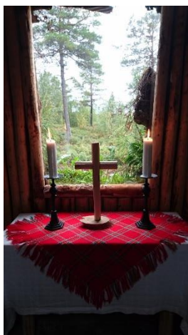
Foto: Alteret i kirkegammen på Drag

Samefolkets dag 6. februar, er blitt en tydelig markør av samefolkets kulturelle og historiske bevissthet. Flere menigheter er med i lokale markeringer, da ofte med gudstjeneste. Det er avholdt større arrangementer i Tysfjord, Hamarøy og Bodø. Vi ser at stadig flere menigheter markerer Samefolkets dag på tilliggende søndagsgudstjeneste. Dette har vært en god mulighet for menighetene til å ta i bruk samisk språk og kulturuttrykk i gudstjenesten, og kan forhåpentligvis styrke bevisstheten om å bruke samiske liturgiledd i gudstjenesten. Bevisstheten øker om at det fins materiell også til bruk i andre kirkelige sammenhenger.