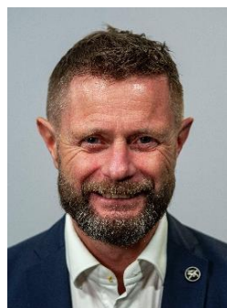
Bent Høie Statsforvalter i Rogaland