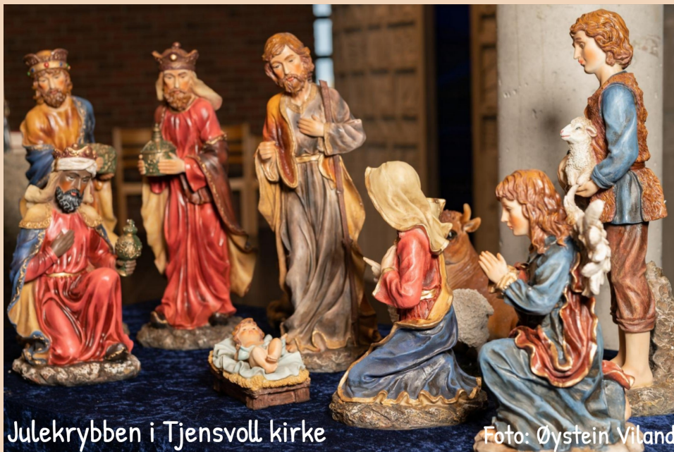
Julekrybben i Tjensvoll kirke