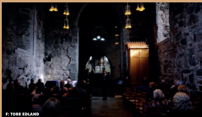
F: TORE EDLAND