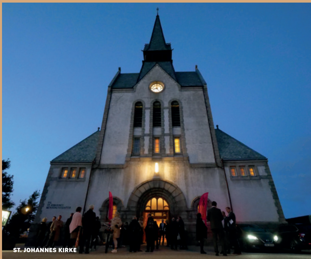
ST. JOHANNES KIRKE