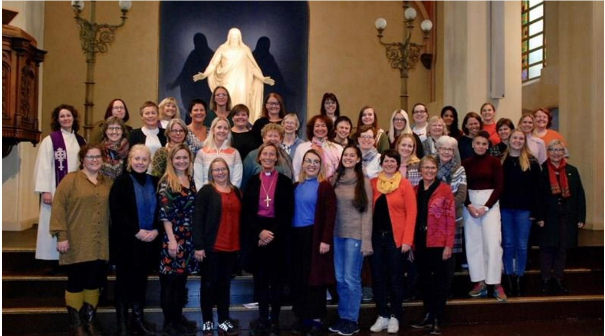
I oktober var rundt 40 kvinnelege prestar og teologistudentar samla til nettverksmøte.

Me ser at hovudutfordringa vår er å auka kvinnedelen i presteskapet og talet på kvinner i leiarstillingar. Dette skjer stort sett gjennom rekrutteringsprosessane. Her er det tilfanget av søkarar som er avgjerande, og me håpar å auka talet på kvinnelege søkarar.