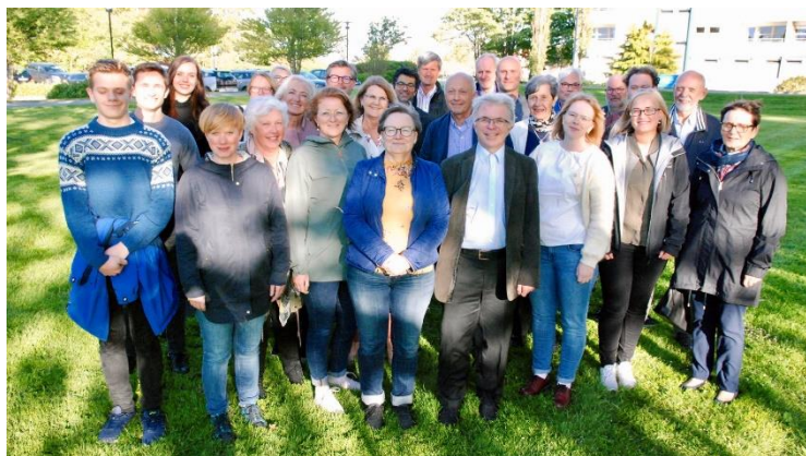
Kandidatar til valet av Stavanger bispedømmeråd samla på informasjonsmøte.

På kurs for nye sokneråd møtte me mange dyktige og engasjerte nye medlemmar av sokneråd, i ulike aldersgrupper. Prostane seier det har vore utfordrande å rekruttera folk til sokneråd, men resultatet verkar bra.