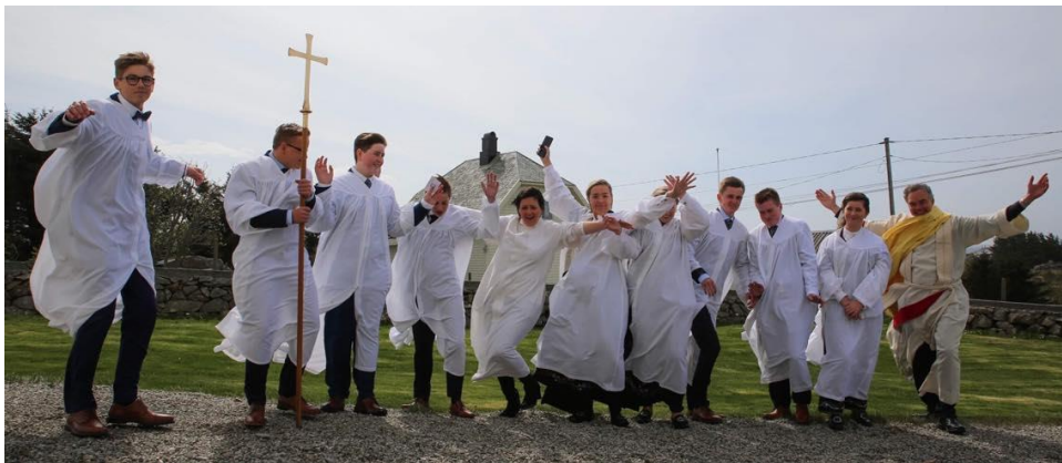
Vel blåst for konfirmantane i Ferkingstad sokn.

I Stavanger sentrum ønsker fire sokn å styrka konfirmantarbeidet gjennom samarbeid mellom fleire kyrkjelydar, i eit prosjekt dei har kalla «Konfirmant i sentrum».