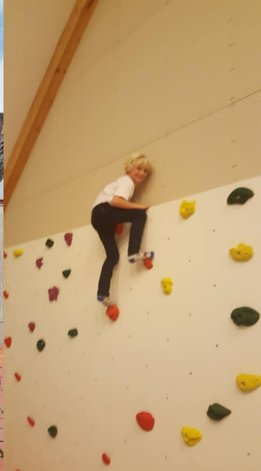
Kyrkjeonsdag i Aksdal.