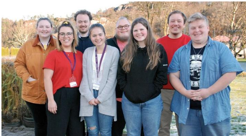
Nyvalt ungdomsråd på Ungdomstinget 2019 på Stemmestaden.

Fleire unge engasjerte seg i kyrkjevalet hausten 2019, noko som resulterte i fleire unge medlemmar i både sokneråd og bispedømmeråd.