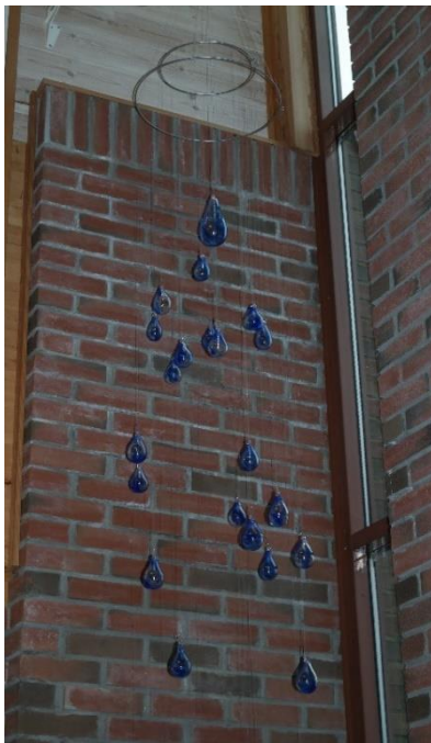
Dåpsdropar frå Madlamark.