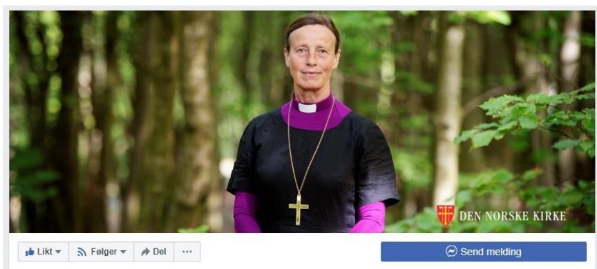
Facebook-sida “Stavanger biskop Anne Lise Ådnøy”.

Bispedømmerådet behandla ei sak om kommunikasjon hausten 2019, med vedtak om at rådet får framlagt ein kommunikasjonsplan med strategi og prioriteringar innan utgangen av 2020. Hausten 2019 vedtok bispedømmerådet å auka kommunikasjonsressursen på bispedømmekontoret frå 50% til 100% stilling.