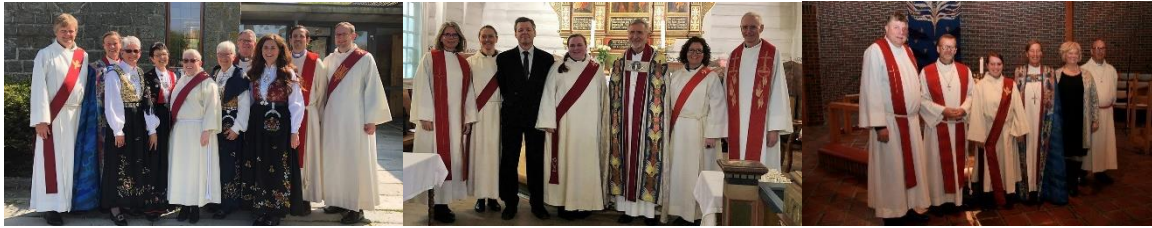
Nokre vigslingar frå 2019: Diakon i Sola, diakon i Egersund og kantor i Hundvåg.

Opplegget “Kven gjer kva i kyrkja?”, som er eit utviklingsprosjekt støtta av Kyrkjerådet, blir lansert i 2020. Det rettar seg mot konfirmantar med informasjon om dei ulike vigsla stillingane som finst i kyrkja. Det blir utarbeidd ein film og eit fleksibelt undervisningsopplegg til bruk i undervisninga.