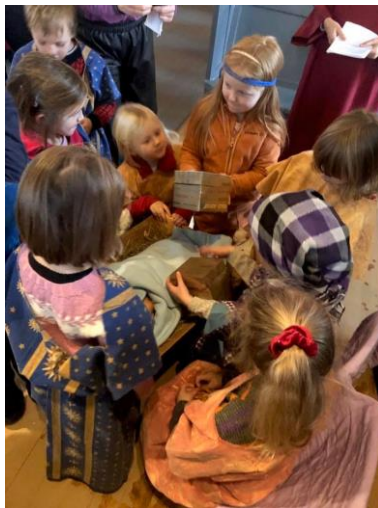
Barnehage på julevandring i Sauda kyrkje.

Vidare trur me at det kan vera meir å henta når det gjeld skulegudstenester på ungdomsskuletrinnet.