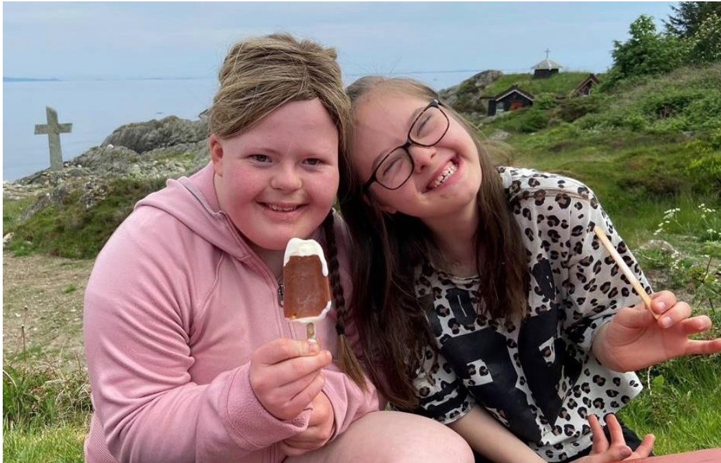
Årets mest likte bilete, frå HEL-koret si sommaravslutning på Fredtun, Karmøy.

I 2021 starta me Instagramkontoen @KirkeniRogaland". Den fekk 250 fylgjarar og hadde 58 innlegg i perioden frå 1. september til 31. desember, det vil seia 3,4 innlegg pr. veka. Ein satsing i denne kanalen var ein adventskalender med kyrkjetilsette og frivillige som viste fram sin favorittjulepynt. Kanalen nådde i 2021 nær 900 kontoar (eit overslag grunna manglande statistikk frå dei fyrste månadene). Planen var å visa fram fine kyrkjebygg og vakre detaljar til eit breiare publikum enn me har på Facebook. Likevel ser me her òg at innlegg om folk skapar størst interesse.