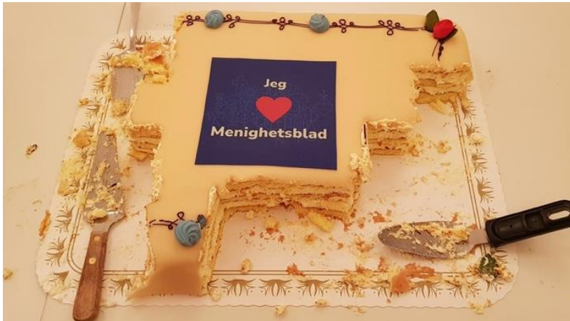
Kake til deltakarane på Fest for menighetsblad i november.

november, saman med Stavanger kyrkjelege fellesråd. Dei over 70 deltakarane skal vidare få tilbod om skrivekurs og andre kompetanse- og ressurstiltak for å styrka blada.