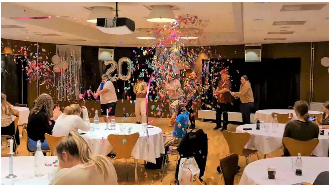
20 års-jubileet for Ungdomsdemokratiet ble feiret på Ungdomstinget.

Deltakarar har gjeve gode tilbakemeldingar og bekrefta at den endringa som har vore gjort med tanke på program og form har vore riktig. Ungdomsrådet vil arbeida med å vidareutvikla Ungdomstinget og håpar å kunna engasjera enno breiare i åra som kjem. I 2021 har me planar om å kombinera ungdomstinget med ein ungdomskonferanse.