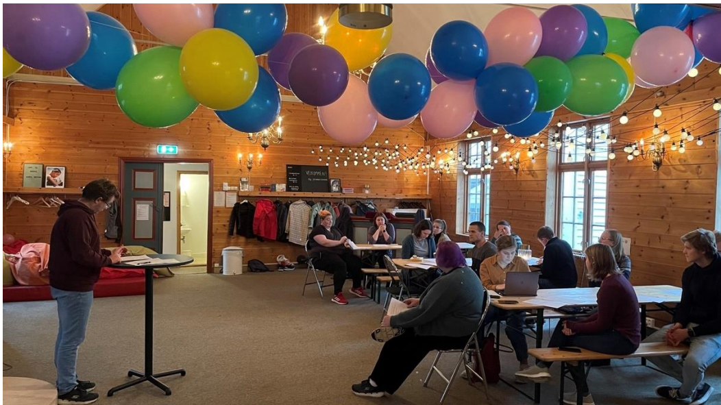
Frå årsmøtet i Spill&chill og Mat&prat i Ukirke.

Fleire kyrkjelydar har erfaringar med at det kan ta tid å bygga opp tiltak for ungdom. Det er lettare å få god oppslutning om tiltak for 10-12-åringar. Mellom anna seier prosten i Karmøy at fleire kyrkjelydar lukkast med dette. Kanskje kan fleire etter kvart bygga ungdomsarbeid på dette? På rådsleiarssamlinga i 2022 skal arbeid for denne gruppa vera eit tema.