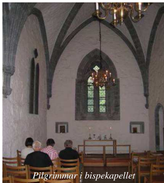
Pilgrimmar i bispekapellet

Bispedømmestaben la ut på pilegrimsferd frå Stavanger i mai 2010 til Utstein, Avaldsnes, Moster, Bergen, Gulen, Selje og Kinn. Dette er naturlege stoppestadar langs Vestlandskysten når Kystleia skal merkast. I samband med reisa er det utarbeidd ein guide for nye pilegrimar som ønskjer å ta vegen i framtida. Det lokale vertskapet langs leia er meir enn klar til å ta imot pilegrimar og utvikle den infrastruktur som trengs for dei som kjem innom.