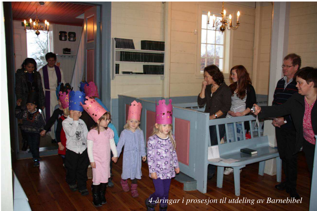
4-åringar i prosesjon til utdeling av Barnebibel

Av dei 126 rapporterte tiltaka frå dei 28 sokna i gjennomføringsfasen (ved eit utval representative trusopplæringstilbod) har 34 ein høgare oppslutning enn 90% (dvs 26,98%). Særlig er det dåpssamtalen og konfirmasjonen som får ei så høg oppslutning, men og utdeling av bok til 4åringane har i nokre av sokna ei oppslutning på mellom 60 og 80 %. Dette viser at det er dei godt innarbeida tiltaka som får størst oppslutning (dåpssamtale og konfirmasjon). Dette samsvarer godt med KIFOs Tilstandsrapport om Den norske kirke for 2010.