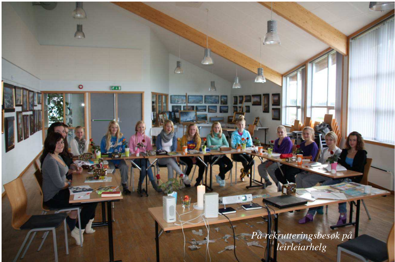
På rekrutteringsbesøk på leirleiarhelg

Av andre tiltak vil vi arbeide med å tilretteleggje rekrutteringsmateriell med kjønnspektiv.