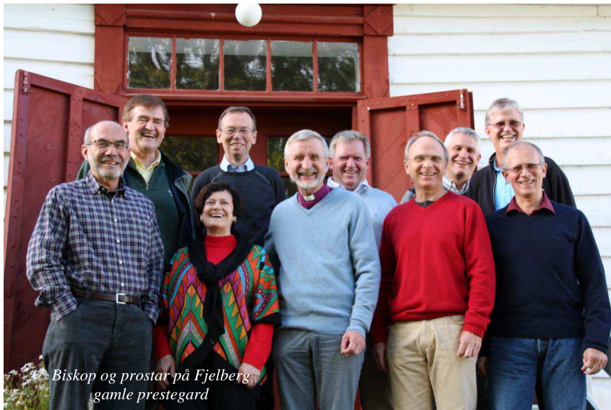
Biskop og prostar på Fjelberg gamle prestegard