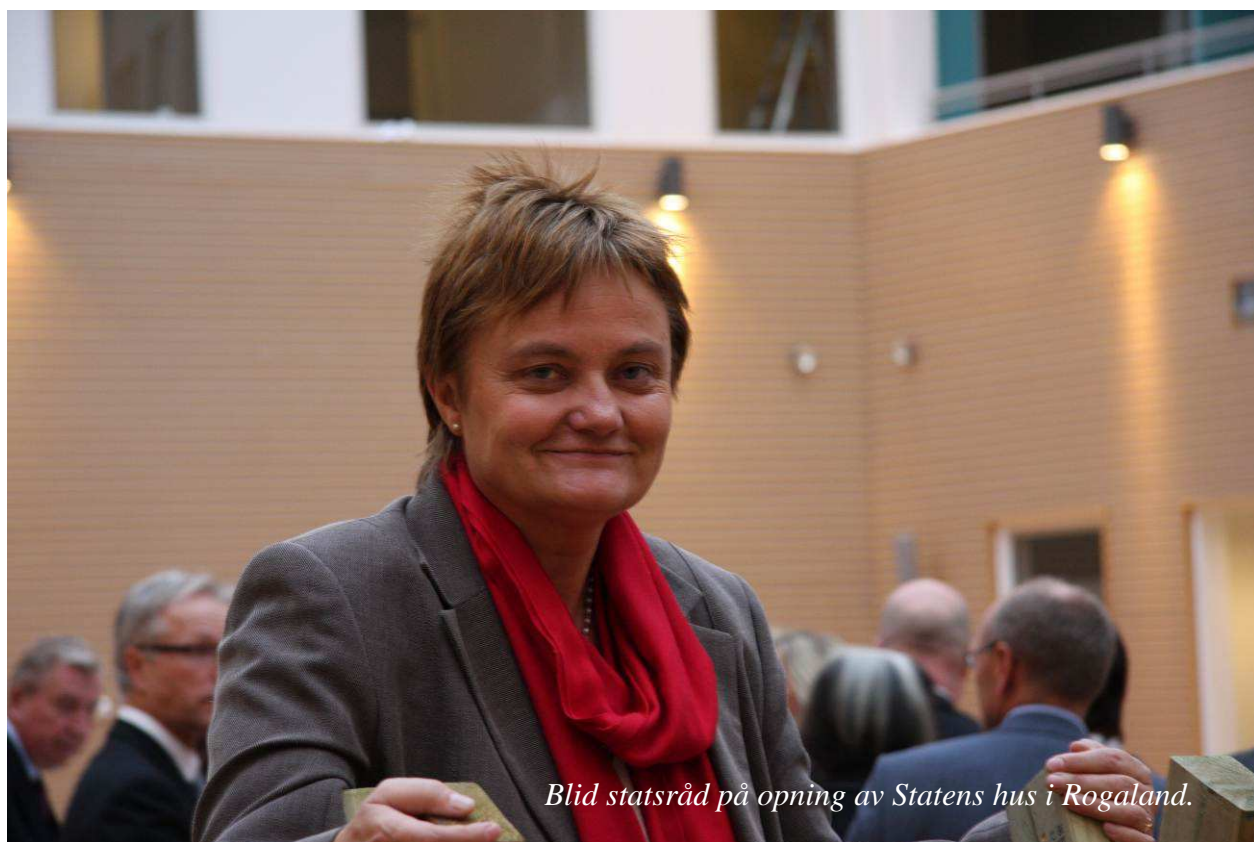
Blid statsråd på opning av Statens hus i Rogaland.

2010 har vore eit stramt år budsjettmessig, og fokus på budsjettoppfølgning har vore ekstra stort. For å sikre at prostane var innforstått med den økonomiske situasjonen, samt for å auke deira kompetanse på økonomiforvaltning, blei det i januar 2010 arrangert eit seminar for prostar og prostesekretærar. Her blei budsjett for presteskabet presentert. Vidare blei prostebudsjetta og rutinar innanfor økonomiområdet gjennomgått.