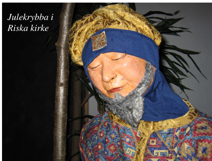
Julekrybba i Riska kirke

representert ved Carissimi, tenkjer annleis om dette.