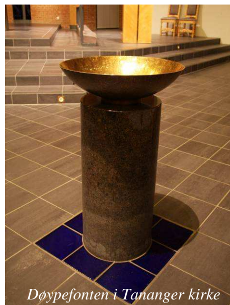
Døypefonten i Tananger kirke

Gudstenestelivet i Stavanger bispedømme er mangfaldig. Her finst heile spekteret frå kyrkjelydar som oftast feirar tradisjonelle høgmesser til dei som nyttar ein lokalt utvikla liturgi. Gudstenesteforma i kyrkjelydane i bispedømmet kan truleg grupperast slik: