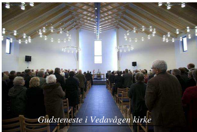
Gudsteneste i Vedavågen kirke

Me finn markert vekst i gjennomsnittleg gudstenestedeltaking i sokn som Bjerkreim, Hjelmeland, Skjold, Vikedal, Sola, Åkra, Tasta, Bore, Bryne, Undheim, Ålgård og Hana. Desse kyrkjelydane har i snitt fått rundt 20 fleire gudstenestedeltakarar det siste året. Fleire av desse kyrkjelydane er bygdekyrkjelydar. Mellom dei større kyrkjelydane som veks, har både Sola, Bryne, Ålgård og Åkra har prosjekt med kyrkjelydsplanting eller gudstenester utafor sjølve kyrkjebygget. Dette er òg område der folkevekst slår ut i auka gudstenestedeltaking.