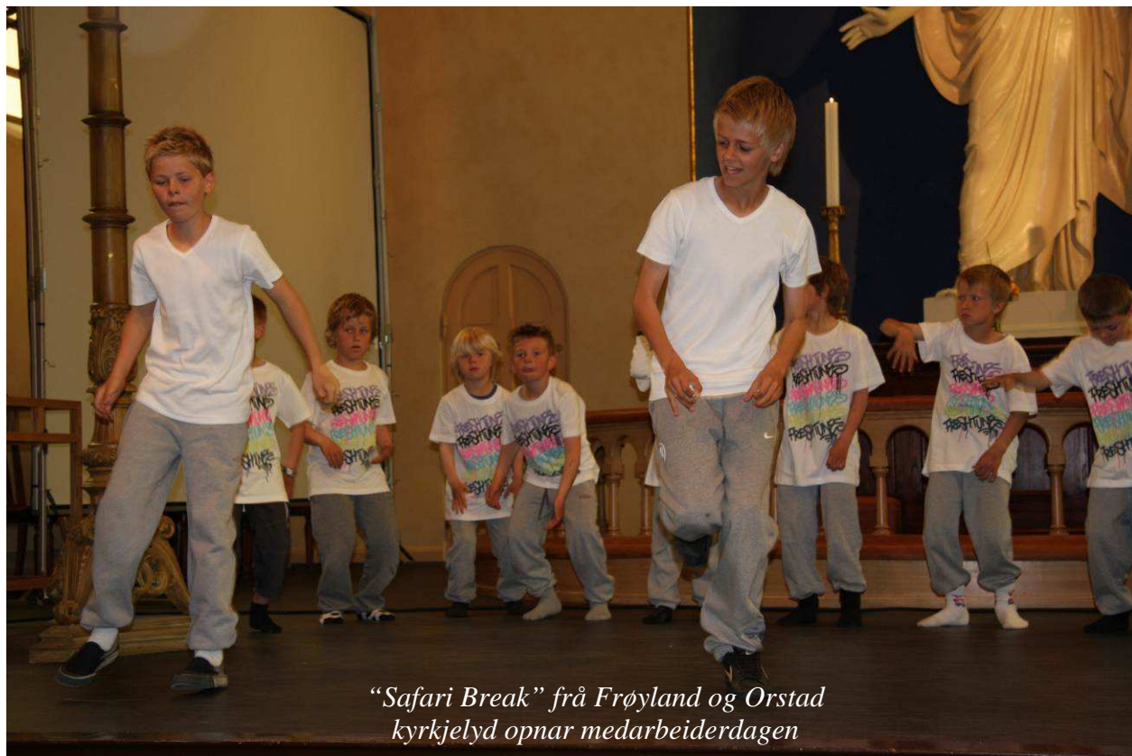
“Safari Break” frå Frøyland og Orstad kyrkjelyd opnar medarbeiderdagen

Det er interessant at desse kyrkjelydane er svært forskjellige. Nokre eksempel: Domkyrkja satsar på ei klassisk gudsteneste gjennomsyra av kunstnarisk kvalitet. Frøyland og Orstad brukar nyare lovsong og har satsa stort på frivillig teneste i samband med gudstenestene. Nærbø er trusopplæringskyrkjelyd og har ein søndagsskule som eit stort samlingspunkt i samband med gudstenestene. Vi ser at forskjellige gudstenester trekkjer mange menneske.