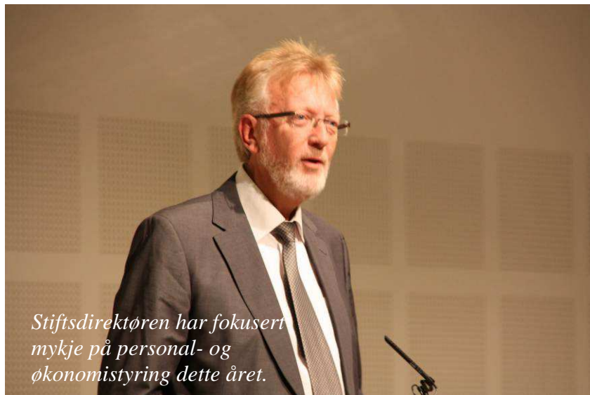
Stiftsdirektøren har fokusert mykje på personal- og økonomistyring dette året.

regelverket for sjukefråver, arbeidsklarleggjing og tilbakeføring til arbeidslivet. I dette arbeidet har vi hatt god hjelp av IA-kontakt og bedriftshelseteneste. Vi arbeider for å utvide tilbodet om bedriftshelsetenesta til fleire prosti.