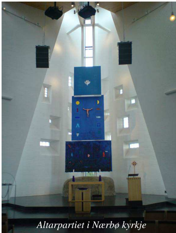
Altarpartiet i Nærbø kyrkje

Det skjer endringar i utviklinga i mange kyrkjelydar i Rogaland. I 2010 forordna Stavanger biskop ca 600 gudstenester der menneske samlast til gudsteneste utan at dei har eit vigsla gudshus å gå til. Det er langt feire slike gudstenester rundt om i bispedømmet, men sjølv forordninga må avgrensast av omsyn til kor mykje offentleg presteressurs bispedømmet kan nytte til å gjennomføre desse.