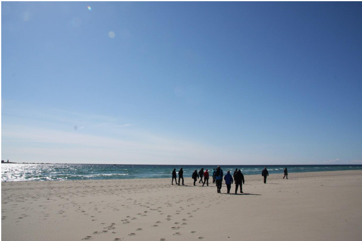
Vandring på Jærstrendene.