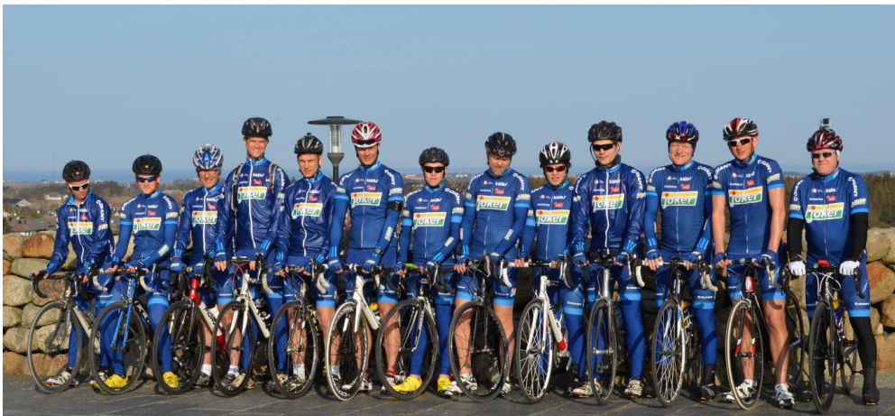
Denne gruppa sykla Noreg på langs for forsoning i Israel og Palestina.

Når alle kyrkjelydane nå er inne i reforma, vil det verte betre tid til å arbeide med innhaldet i trusopplæringa og utvikla kompetansehevande tiltak for tilsette og frivillige. I tillegg til konfirmasjon, ser vi for oss at vi vil arbeida vidare med korleis livstolking og livsmeistring betre kan innarbeidast i trusopplæringa, og korleis dei sentrale dimensjonane i større grad kan koplast til dei ulike tiltaka kyrkjelydane har. Vidare ser vi for oss at tverrfagleg arbeid og trusopplæring som kyrkjelydsutvikling vil vere aktuelle tema.