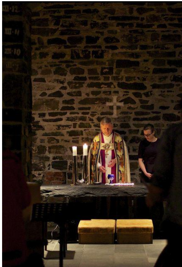
Biskopen i Sola ruinkyrkje

I sum opplever vi at dei grunnleggjande rammene for godt kyrkjedemokrati er på plass, samtidig som både ordningar og bruken av dei er under utvikling og må arbeidast vidare med. Ikkje minst er det viktig å engasjera veljarane og å vidareutvikla den demokratiske kulturen i kyrkja, både i samband med val og i den daglege styringa av kyrkja. Samtidig må heller ikkje den demokratiske strukturen bli så tungrodd og ressurskrevjande at uforholdsmessig mykje energi går med til tunge prosessar som kunne vore løyst enklare og betre utan å gå ut over grunnleggjande demokratiske ideal.