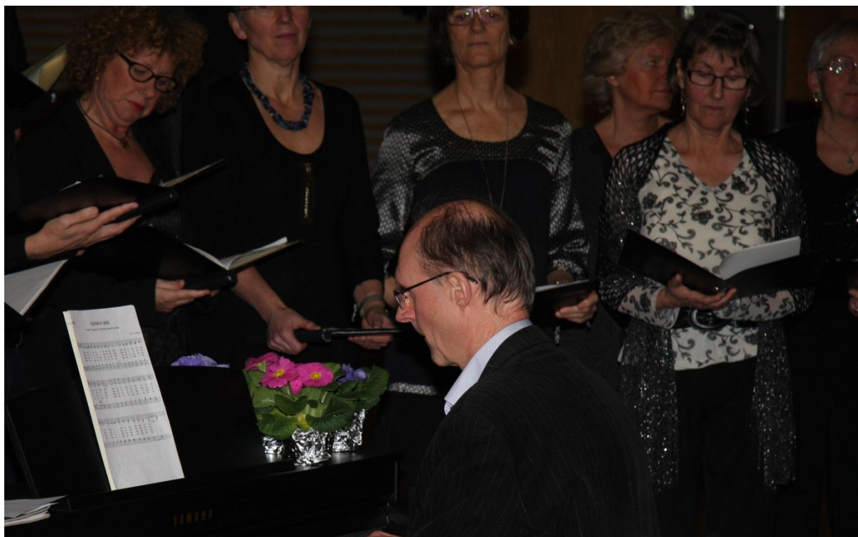
Kantor Ernst Monsen og Gausel kyrkjekor

Kyrkja som forvaltar av- og arena for ulike kunst- og kulturuttrykk: Vi ser at det er behov for å arbeide med dette på ein vidare måte, mot fleire målgrupper. Det vil framover være viktig å ha dette som tema for dei nye sokneråda og finne arenaer for å setje dette på dagsorden for dei andre tilsette i kyrkjene. Det er ønskeleg å skape arenaer kor kyrkjemusikaren og andre tilsette er saman om dette temaet. Vi ser også at det er behov for å ha fokus på viktigheten av gode rutinar rundt rapportering av tal for kulturarrangement i våre møter med kyrkjelydane.