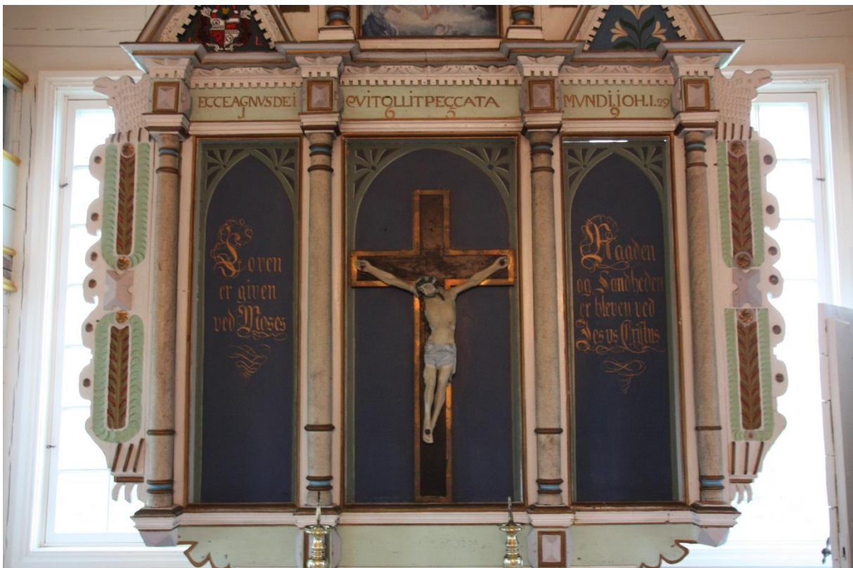
Altertavla i Orre gamle kyrkje

Det kan derfor bli nødvendig å kutte noko i gudstenestetilbodet i bispedømmet, ut frå økonomiske omsyn. Ei viktig premis for dette arbeidet vil då vere å ikkje gå bort frå prinsippet om å vere ei kyrkje som er til stades over alt i bispedømmet. Samtidig ser vi at tilbodet kan bli redusert meir enn etterspurnaden tilseier, og til eit klart lågare nivå på gudstenestetilbodet i tilsvarande kyrkjelydar enn det vi kjenner til at andre bispedømmer har.