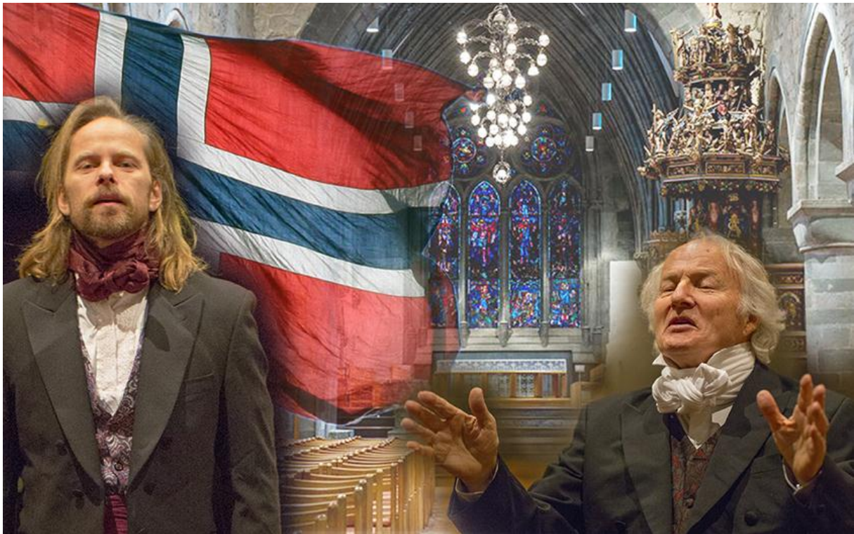
Frå eit av dei kyrkjelege arrangementa ved grunnlovsjubileet.

Departementet sine mål og indikatorar er inkluderte i Kyrkjerådet sine, om enn i ei anna rekkefølge. For å likevel sikra oss at målformuleringane frå departementet blir skikkeleg kommentert, kjem det eit oppsummerande avsnitt om dette til slutt i denne seksjonen.