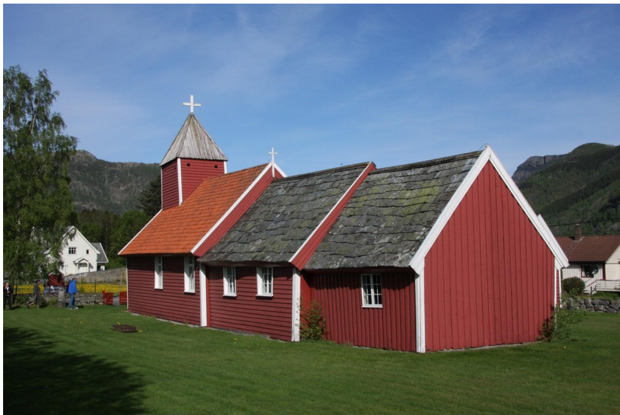
Årdal gamle kyrkje

Stavanger bispedøme manglar ein samla strategi for frivillig medarbeidarskap, kor soknerådene og dei ansatte arbeidar saman. Dette blir eit viktig satsningsområde i 2015 og kjem mellom anna til å bli eit tema i kursinga av dei nye sokneråda.