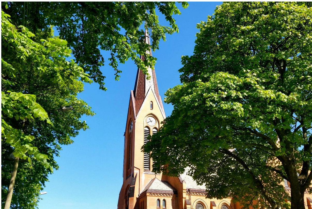
Vår Frelses kirke, Haugesund