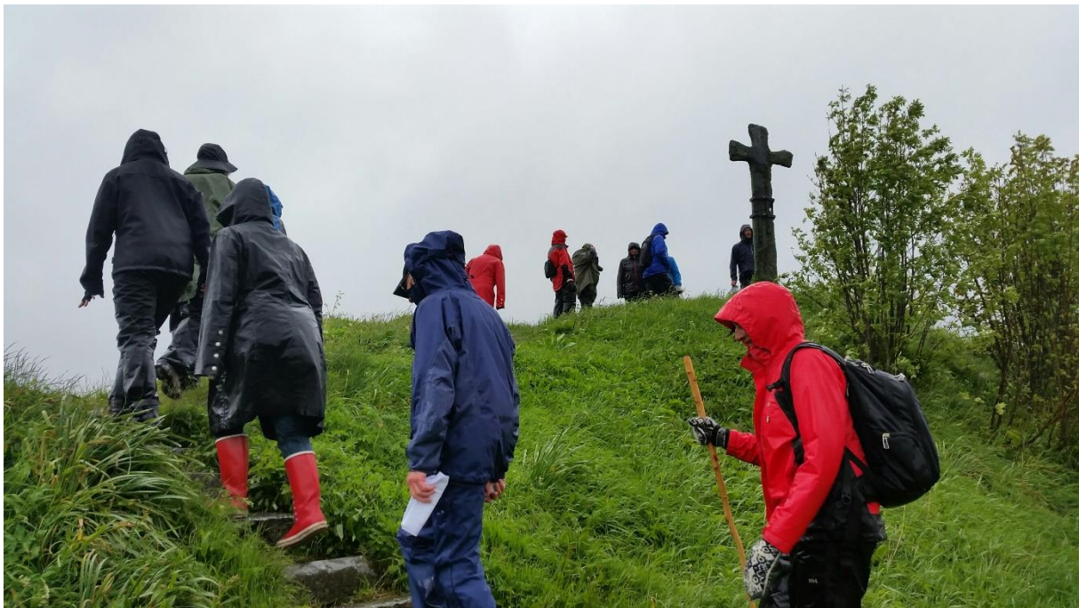
Samling på Krosshaug

Årsrapporten viser kva som skjer i kyrkja, men mellom alt som er nytt viser den kanskje aller mest det som er stabilt, at utan kyrkje ville det vore mindre høgtid, mindre omsorg, mindre fellesskap, mindre aktive lokalsamfunn, færre tilbod til barn og unge og tomt der det nå er nærvær. Sidan det ikkje er slik, men kyrkja faktisk får vera til stades, er me glade for å få vera med på det spennande oppdraget det er å vera kyrkje i vår tid, også når ikkje alle vegar er teikna ferdig.