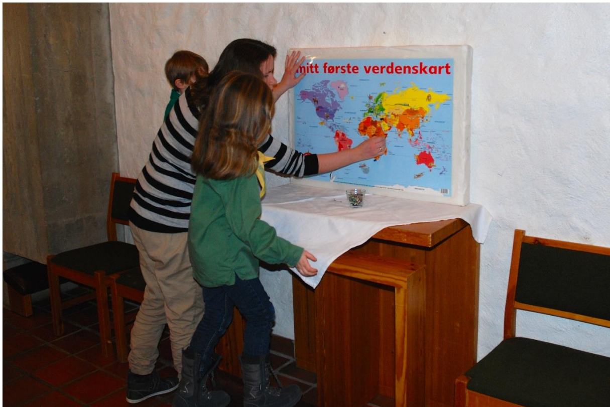
Speidarar på bønemandring i Rossabø kyrkje

Erfaringane frå 2015 tyder på at ein skal fortsetta å fokusera meir på kvalitet i misjonsavtalene enn på kvantitet. Her ligg det eit særskilt ansvar på dei SMM-organisasjonane som har mange avtaler i bispedømmet. Elleser det viktig å satsa vidare på kompetanseutvikling. Kyrkjelydane treng å bli utfordra på kor viktig misjon er og korleis dei kan setta misjon i fokus. I 2016 vil det både bli satsa på nye sokneråd og misjonsutval, og me vil fokusera tematisk på satsingsområde hos organisasjonane som kan vera særleg relevante for kyrkjelydane.