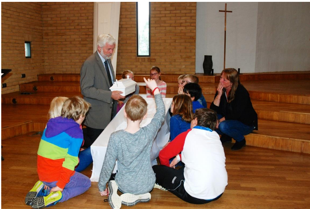
Skulebarn på besøk i kyrkja lærer om sorg og gravferd

I årsplanen for 2016 har me tre tiltak. Me vil drøfta om det er behov for kompetanseheving for prestar. Tala frå brukarundersøkingane viser ikkje akutt behov for dette. Dessutan held me fram med møtepunkt med gravferdsbyrå. Gravferd er også eit aktuelt tema for prostar og kyrkjevevjer.