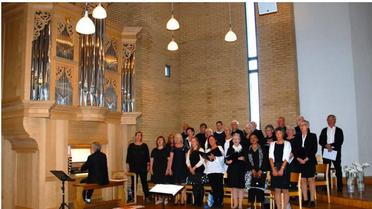
Nytt orgel i Udland kirke

Det store biletet når det gjeld deltaking på gunder, er uansett at den gjennomsnittlege deltakinga på hovudgunder er svalt. Slik har det vore i mange år. Kva som gjer at folk går fast til kyrkja eller besøker kyrkja i samband med spesielle hendingar endrar seg lite frå år til år. Kyrkjelydane arbeider aktivt med lokale tiltak for å auka oppslutninga om gunder.