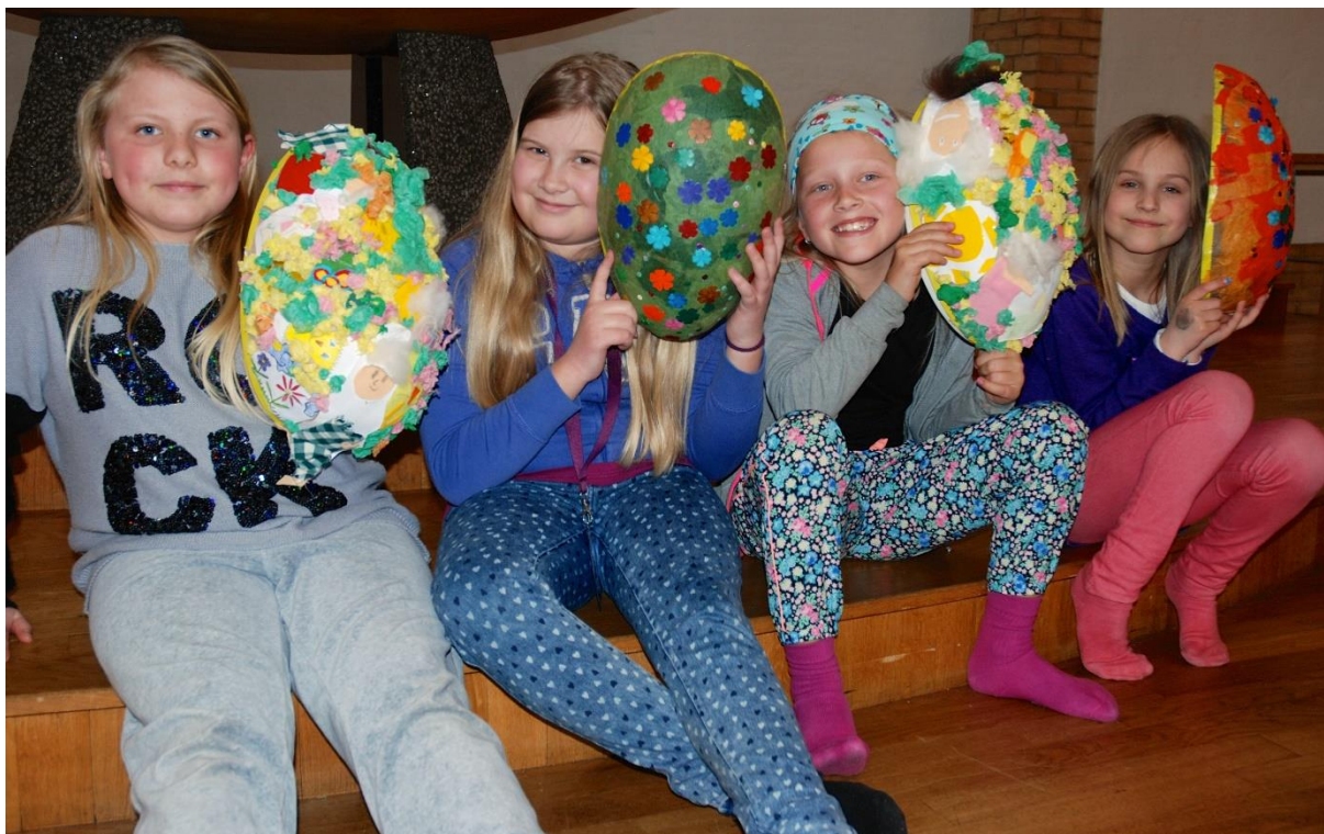
Barn på «Etter skoletid» i Skåre kyrkjelyd førebur seg til påske

At nedgang i oppslutninga om konfirmasjon påverkar oppslutninga om gudstenester, er ein grunn til å satsa på dette framover. Ungdomsarbeid er også eit strategisk satsingsområde i gjeldande strategiplan, og analysen ovafor viser også at det er viktig i samband med gudstenestelivet. Dessutan understreker funna våre at det er viktig at kyrkja er aktivt og positivt til stades i den offentlege samtalen og kulturen. I tillegg til den lokale verksemda i soknet er derfor felleskyrkjeleg informasjonssatsing og breie kommunikasjonsiltak eit satsingsområde som gir meining.