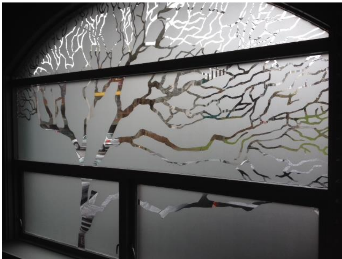
Vindauget i bønerommet i Vår Frelzers kirke

I kyrkja si kulturmelding blir kyrkja utfordra til «å kommunisere med mennesker på alle de språk mennesket har til disposisjon». Dette vil me arbeida meir med, spesielt gjennom å løfta fram kyrkjerommet sin arkitektur og utsmykking.