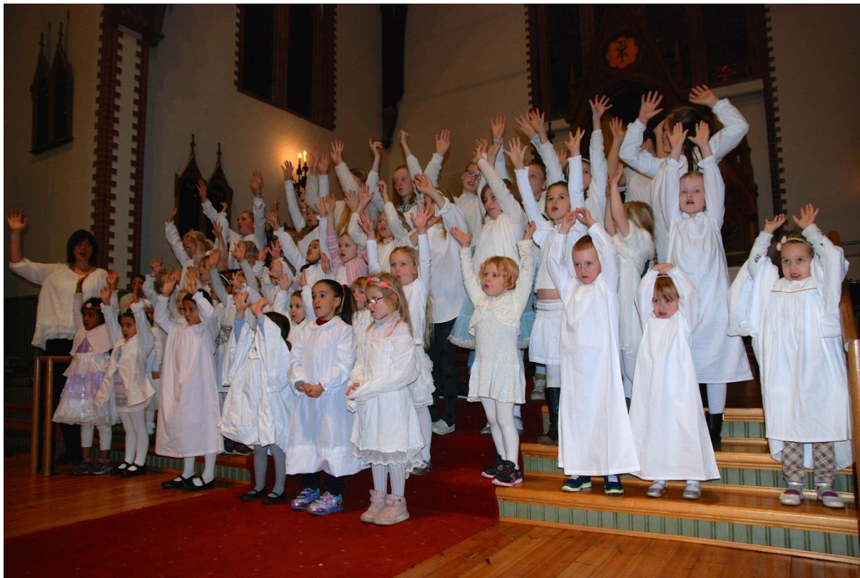
Rossabø mini- og maxigospel

Me vil fortsatt prioritera å vera ute i det operative arbeidet for å ta vare på nærkontakten med brukarar og medarbeidarar. Me vil også stadig arbeida for eit tettare samarbeid mellom inkluderingsarbeidet og trusopplæringa, slik trusopplæringsreforma legg opp til.