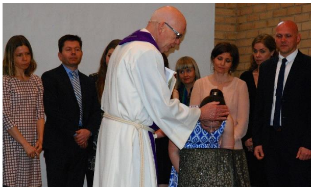
Dåp i Udland kirke

Me har også klart å gjera dåp til eit tema i det offentlege rommet og i mange heimar, gjennom kyrkjelydsblad og kinoreklame. Eit større fokus på dåp i det offentlege rommet kan ha fungert som ein påminning til nybakte foreldre.