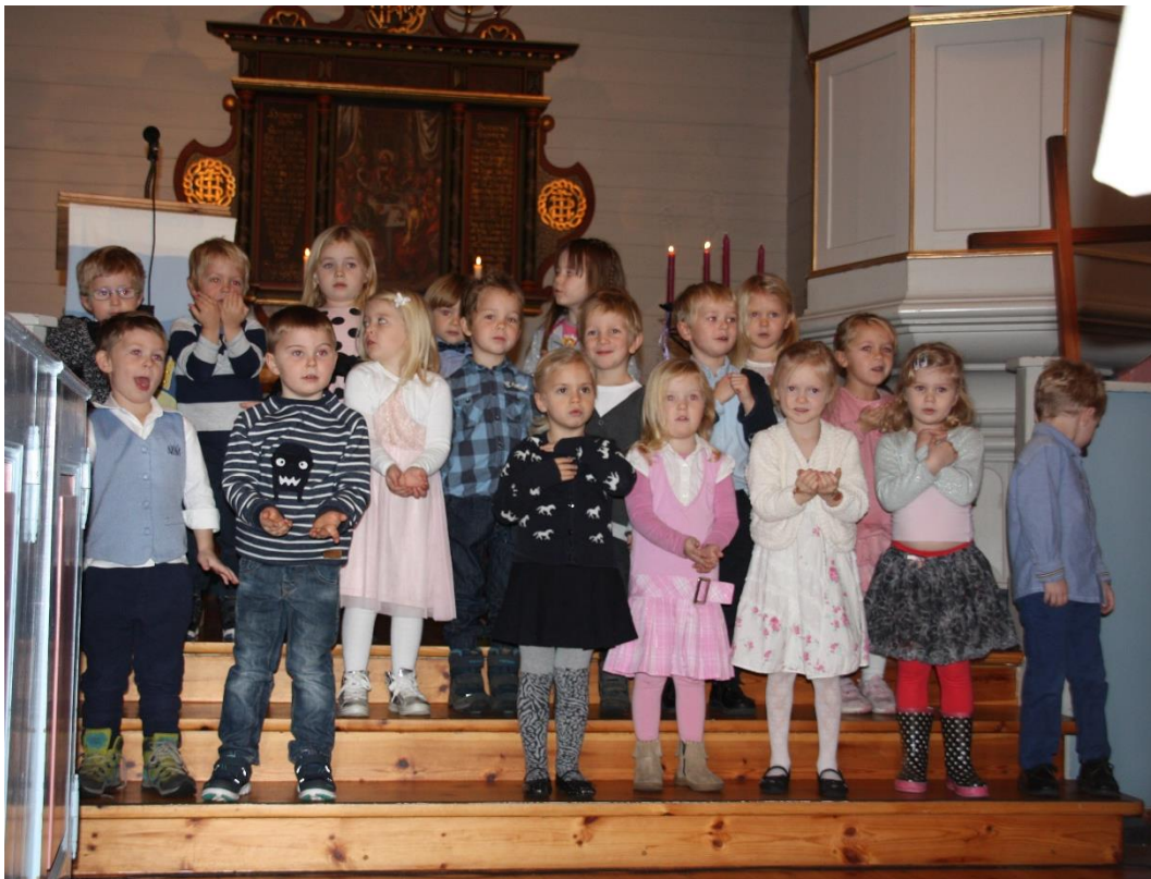
4-åringar på gudsteneste

Å satse på dåp blir derfor sentralt framover, der utviklinga vil ha mykje å seie for kyrkja si plass i folket. Mellom tre og fire tusen barn blir framleis døypte kvart år, men det er plass til fleire.