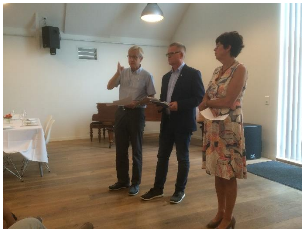
«Sammen om å lede»-samling for prostar og kyrkjevevjer

Fleire fellesråd har slutta seg til Kyrkjebakken i 2016. Me arbeider for at dette skal bli ein naturleg kommunikasjons- og samhandlingsarena for flest mogleg. Dette har me brukt stillingsressurs til i året som gjekk.