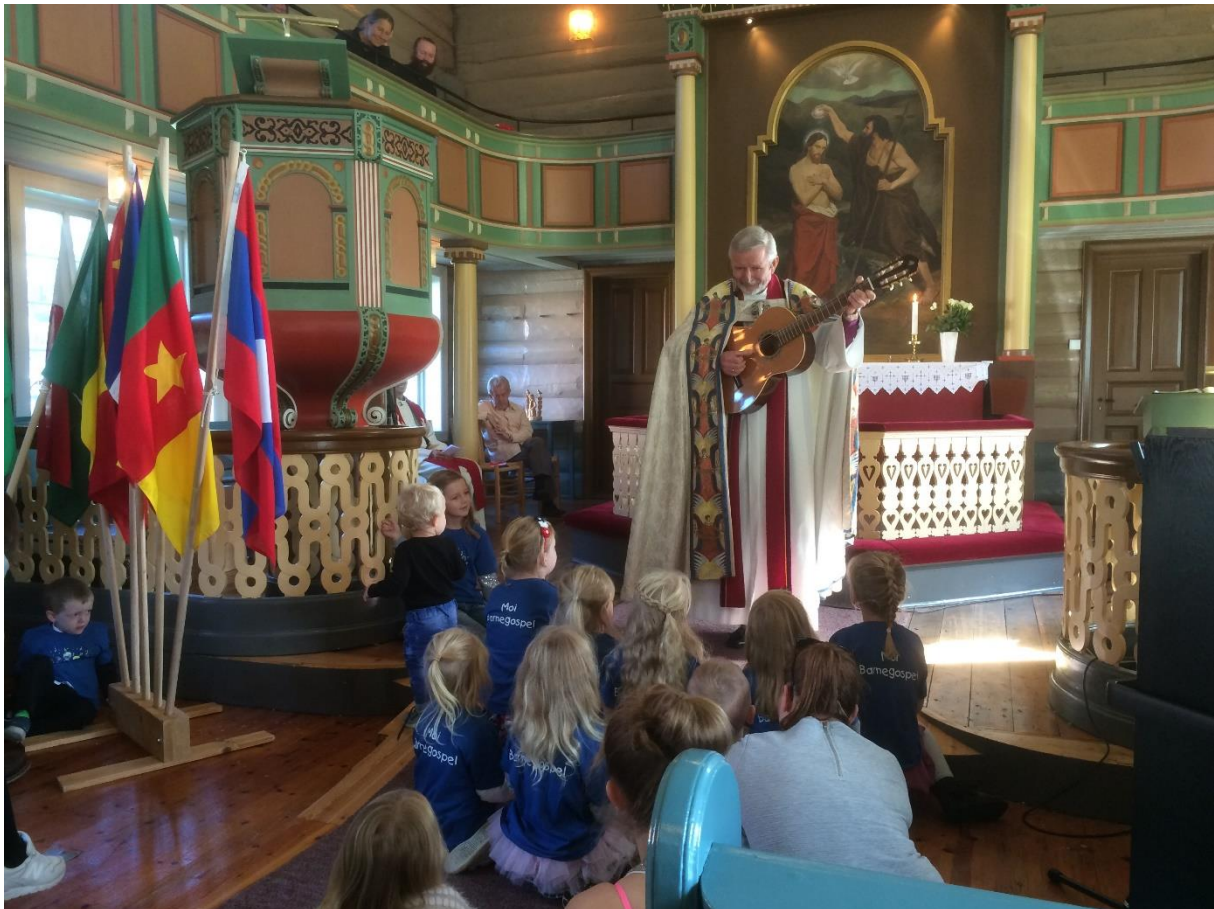
Preike på visitas i Lund kirke

I årsrapportsamtalane blir kyrkjelydane utfordra på oppslutning: Korleis har utviklinga vore dei siste åra og kva kan dei gjere for at fleire skal komme på tiltaka? I 2016 blei årsrapportsamtalane for tre prosti; Ytre Stavanger, Dalane og Tungenes, gjennomførte som prostisamlingar. Med tanke på at eigarskap i staben er eit viktig suksesskriterium i trusopplæringa, er dette ein arbeidsform me satsar på framover. Me ser at slike samtaler legg til rette for at fleire frå staben blir med.