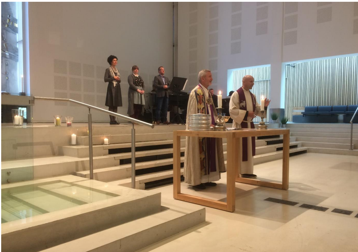
Visitagudsteneste i Frøyland og Orstad kyrkje

Dette er førebels noko prostar, lokale kyrkjelydar og bispedømme snakkar om uformelt. I samband med arbeidet med ny forordning, planlagt i 2017, vil balansen mellom gudsteneste og andre kyrkjelege tilbod bli eit viktig spørsmål. Dette er også eit spørsmål det er viktig å drøfta på nasjonalt nivå. Det fastsette målet er eit styringssignal om å halda gudstenestefrekvensen oppe. Eit spørsmål i forhold til dette er om det er meint så presist og sterkt at det er ei hindring for å flytta ressursar til andre område, viss ein regionalt eller lokalt ser det som nødvendig for å nå andre kyrkjelege mål.