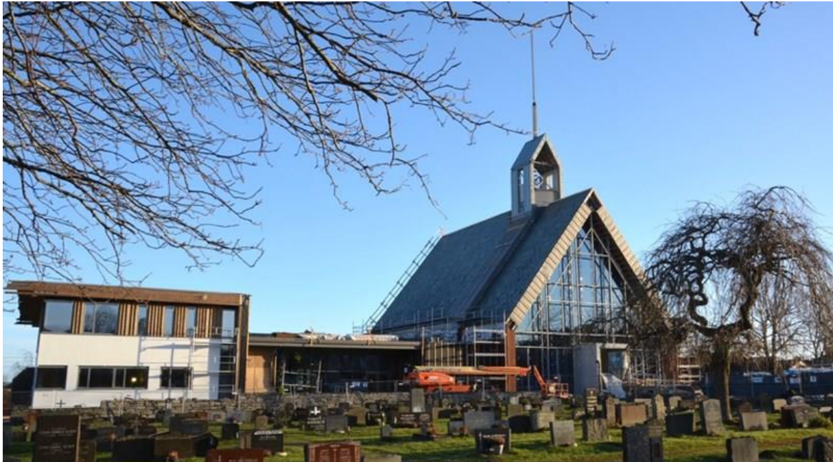
Nye Kopervik kyrkje reiser seg

Generelt ser me at det blir arrangert mange og gode kulturarrangement i kyrkjelydane i bispedømmet. Samtidig ser me at det framleis er behov for å løfta fram kva rolle og funksjon kunsten og kulturen har i kyrkja og i kyrkjelydane.