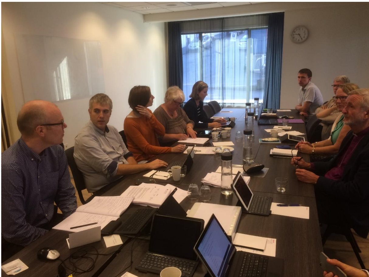
Stavanger bispedømmeråd i arbeid

Stavanger bispedømmeråd 2016-2019 består av fem kvinner og fem menn. I sokneråda i bispedømmet er det 53 % kvinner og 47 % menn. Valordninga verkar altså tilstrekkeleg til å sikra kjønnsbalanse.