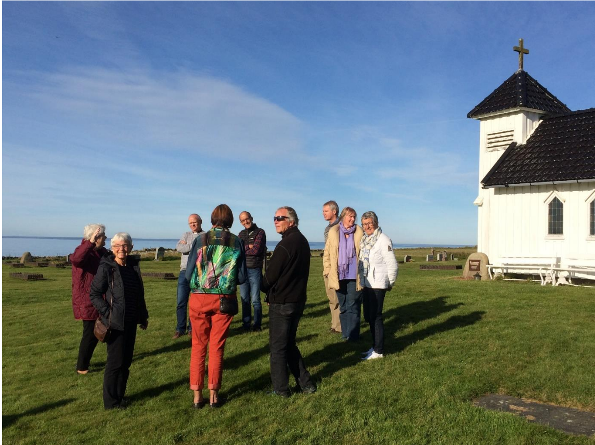
Pilegrimar på Varhaug gamle kyrkjegard

Me har tru på at arbeidet som er i gang vil veksa. Det er ein utfordring at me frå hausten 2016 har mindre stillingsressurs på pilegrimsarbeidet enn tidlegare.