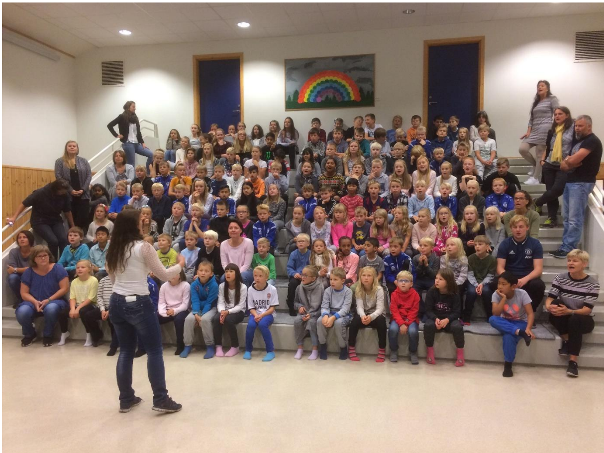
Elevaer syng for biskopen på skulebesøk

Stavanger bispedømmeråd vil følgja nøye med på oppslutninga om konfirmasjon framover, og konfirmasjon vil vera eit område med særleg fokus i 2016/2017.