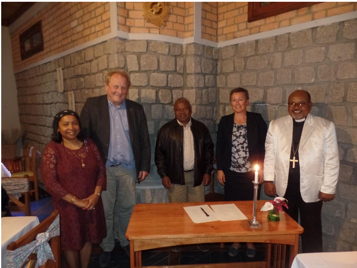
Signering av ny vennskapsavtale med Fianarantsoa-bispedømmet på Madagaskar

Erfaringane frå dei siste åra tyder på at ein skal fortsetta å fokusera meir på kvalitet i misjonsavtalene enn på kvantitet. Det ligg eit særskilt ansvar på dei SMM-organisasjonane som har mange avtaler i bispedømmet. Samtidig er det viktig å satsa vidare på kompetanseutvikling og kommunikasjonsverktøy. Kyrkjelydane treng å bli utfordra på kor viktig misjon er og korleis dei kan setta misjon i fokus. I 2017 vil det både bli satsa på å styrka organiseringa i kyrkjelydane, samt oppfølging frå SMM-partnarane på sine avtalar.