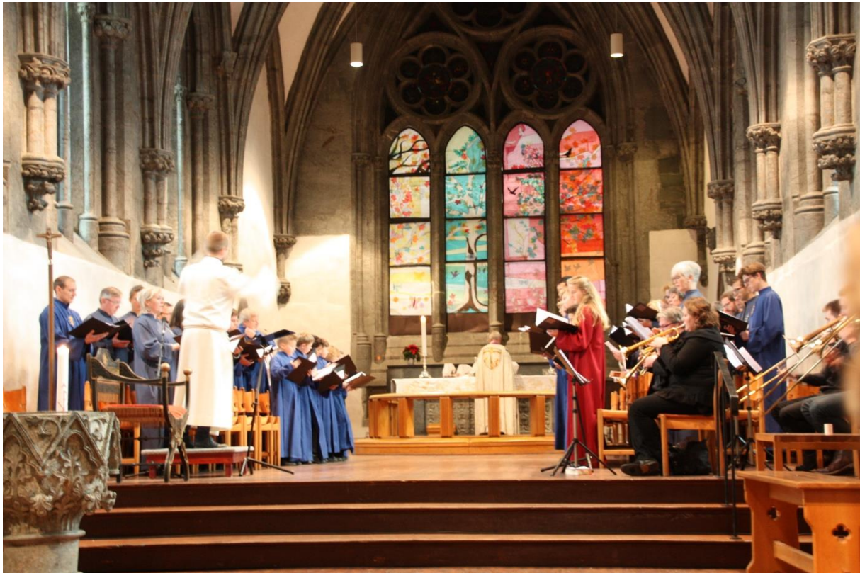
Fra Stavanger domkirke

Korarbeid er viktig, både kulturelt og kyrkjeleg. Det er også viktig med tanke på å halde oppe og styrka song som sentral del av gudstenestefeiringa. Song styrker trua på ein annan måte enn ord og er viktig i seg sjølv å halda oppe. Det blir arbeid med å finne gode tiltak for å styrka og stimulera korarbeidet i kyrkja og setta nye tiltak ut i livet.