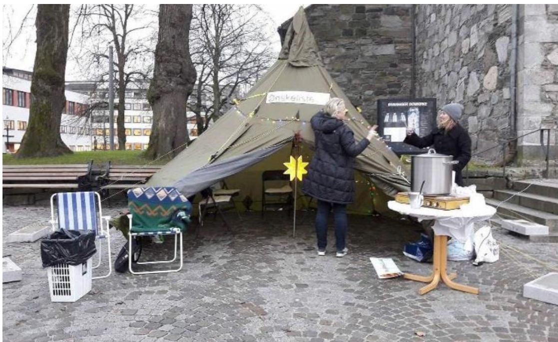
Diakonane i Stavanger på plass i julegata. (Dette er julevær i Rogaland)

I år har det vore samtaler med Kirkens Nødhjelp (KN) om samarbeid mellom bispedømmet sine kontaktpersoner i dei grønne kyrkjelydane og KN sine kyrkjelydskontaktar. Desse samtalenene har blitt ført vidare i 2016.