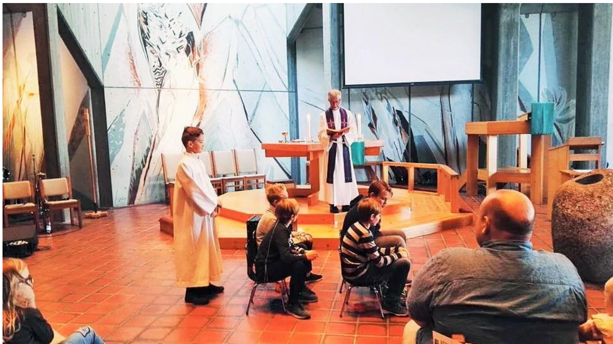
Gudsteneste i Sunde kirke med drama, utdeling av fireårsbok, babysang og misjonstivoli.

Kyrkjeleg nærvær i lokalsamfunnet, fokus på relasjonar, kvalitetsarbeid og frimod på gudstenesta sine vegne kan skapa vekst.