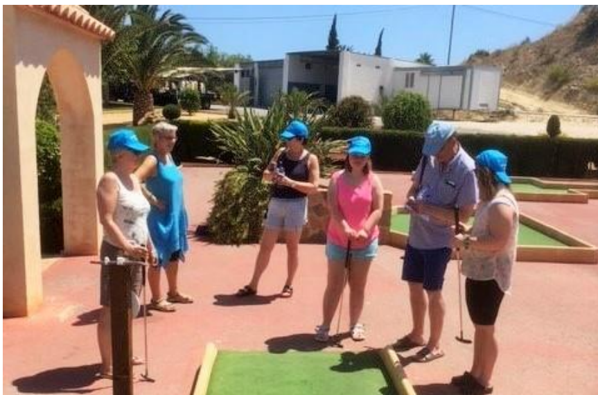
Solgården-turen er ei ferieveke i kyrkjeleg regi for menneske med utviklingshemming. Satsinga gjev «langtidseffekt» og hjelper å nå målet om å inkludera fleire.

Vidare er det viktig å arbeida med korleis me kan rekruttera og inkludera yngre deltakarar og byggja ut dei lokale nettverka. Me vil også hjelpa fleire kyrkjelydar til ei meir aktiv og målretta forplikting på å vera inkluderande. I året som kjem vil me vidareutvikla og styrkja fellestiltak, sjå på verktøyet «vår inkluderende menighet» i prostisamlingar, følga opp tilsette og frivillige leiarar og halda fram dei ressursane og gåvene menneske med utviklingshemning ber med seg.