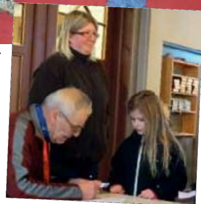
Registrering som Tårnagent.