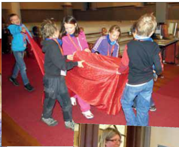
Den siste skatten ble funnet i en balje.