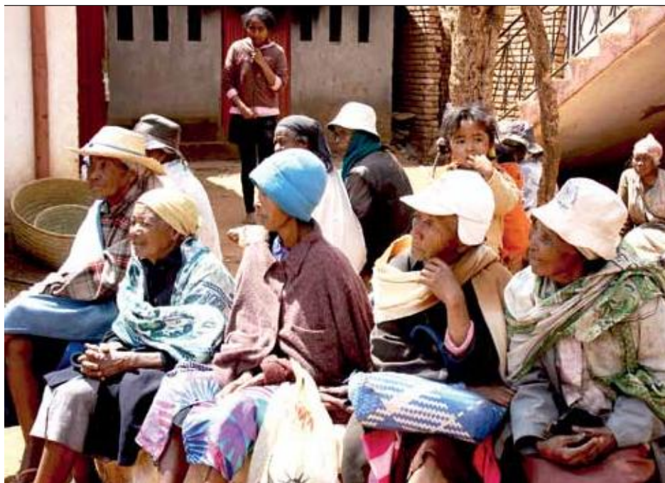
De eldre på tunet.