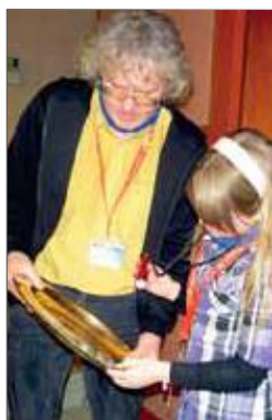
Dåpsfatet er funnet!