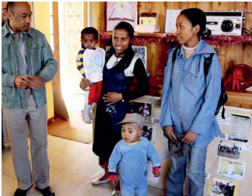
Arbeidstreningsprogrammet med barnehagen.

Fra «bakgården» til kirka i Antsirabe på Madagaskar: