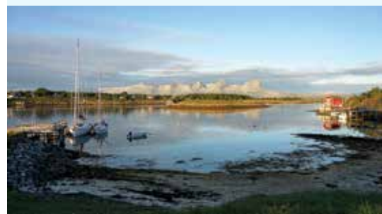
Utsikt mot De Syv Søstre på Alstadhaug.