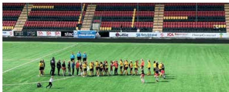
Det var mange åfjordinger som var til stede under Storsjøcupen i sommer. Åfjord jenter 15 tok seg helt til finalen i A-sluttspillet hvor de møtte Sverre fra Levanger. Her takker jentene for kampen som endte 3-2 i Sverre sin favor, denne gangen..!

rens feil. At han lar det utarte seg slik. Det blir jo som å si at det er politiets feil hvis jeg kjører for fort. Jeg kan reglene, og jeg har da ansvaret hvis jeg bryter dem, og må ta straffen som følger. Er fotballspillerne noen tankeløse villdyr som må temmes og som ikke har noe personlig ansvar? Nå merker jeg at jeg høres ut som en gretten gammel gubbe, og det vil jeg jo ikke være (gretten altså). Kanskje er dette en del av spillet, kanskje er det dette som skaper lidenskap og temperatur. Kanskje synes supporterne til Brasil at det er storsvært når Neymar får lurt seg til en straffe eller kort til en spiller på motstanderlaget. Kanskje synes supporterne det er stor-