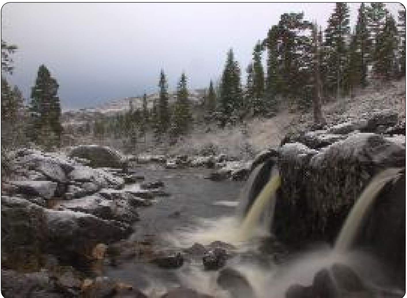
Seinhøst ved Tuvvasselva.