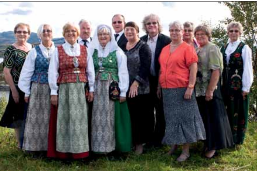
50-års jublanter Stoksund kirke: