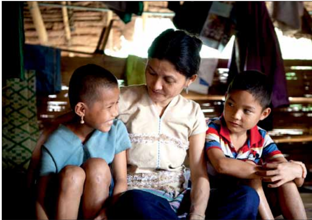
Wah Day Nyar og barna har en dramatisk historie. Men nå øyner de håp.

– Vi jobber med lokale organisasjoner som befinner seg der flyktninger og inntert fordrevne er og gir livsviktig nødhjelp. Vi har gjennom det kirkelige nettverket nådd inn i områder som ellers har