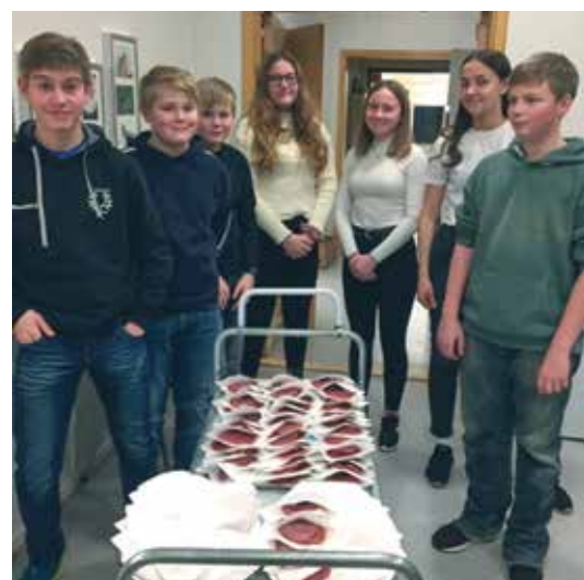
Flinke og trivelige konfirmanter.