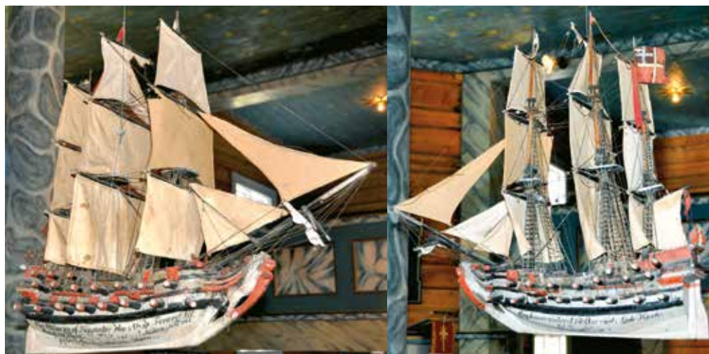
Kirkeskipet i Stoksund kirke med det danske flagget akter.